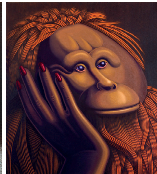
Vladimir Leben, Beg možganov, 2021, olje na platnu, 80 x 70 cm