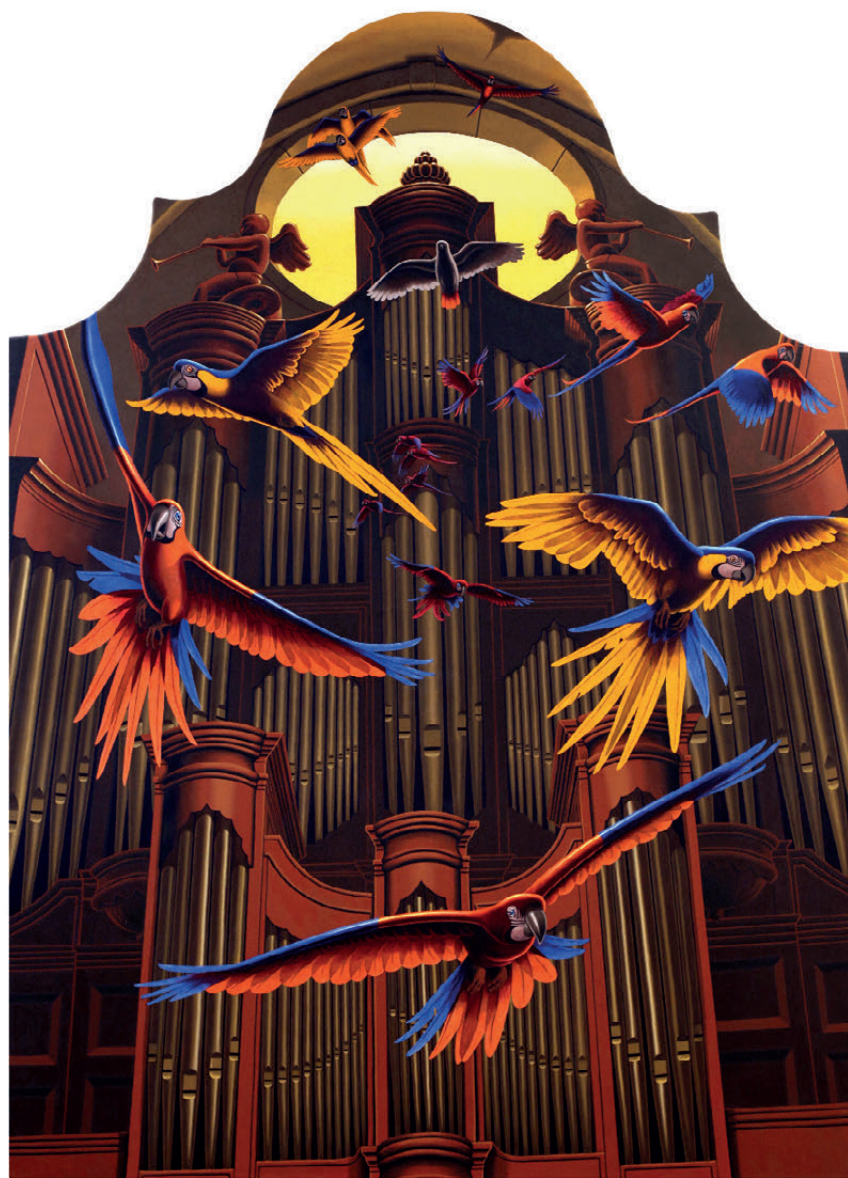
Vladimir Leben, Fuga mundi, 2020, olje na platnu, 203 x 280 cm

Vladimir Leben v svojem avtorskem delovanju izhaja iz klasičnega medija oljne slike na platnu. Izvirni umetnik združuje metjejsko dovršene figuralne kompozicije z bogato narativnimi izjavami, ki z duhovito večpomenskostjo presegajo branje na izključno simbolni ravni. Od začetka umetniške kariere v devdesetih letih pa do danes je ustvarjal tako samostojno kot s sodelovanjem v različnih projektih, v katerih se je združilo več umetnikov.