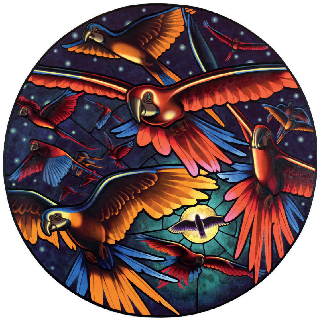
Vladimir Leben, Fiat lux, 2021, olje na platnu, fi 120 cm