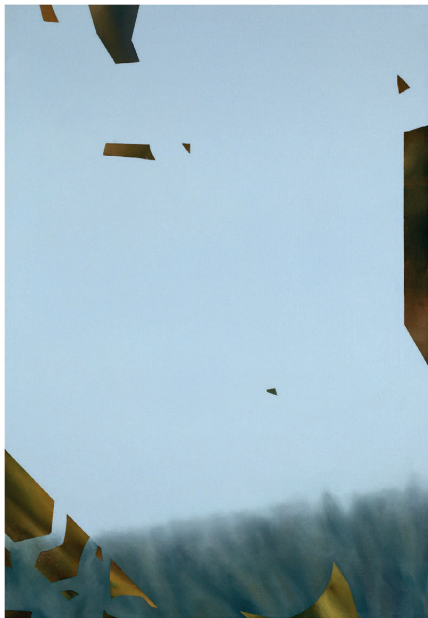
Monika Slemc, JOMO.FOMO.YOLO! 2021, akril na platnu, 100 x 70 cm