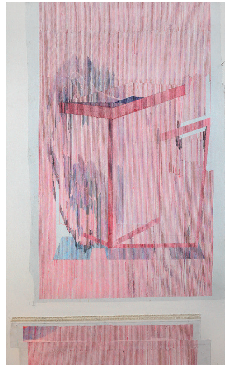
Maša Knapič, Brez naslova, 2021, mešana tehnika, 180 x 111 cm