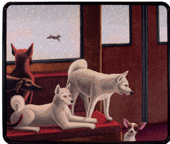
Vladimir Leben z Ercigoj Art, vezena slika UPLOAD, 2016, 49 x54 cm, UPDATE, 2017, 72 x 67 cm, BACKUP, 2018, 82 x 69 cm