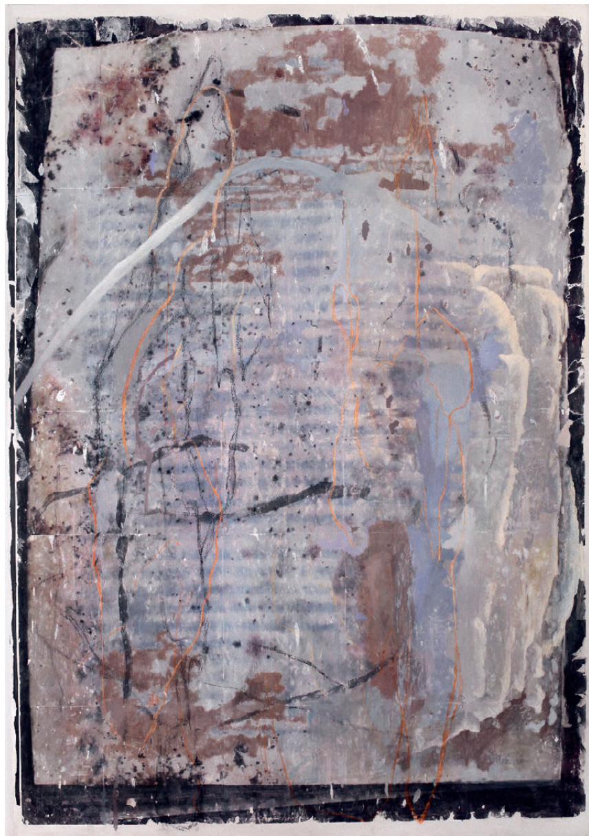
Anastazija Pirnat, Reči nič kar tako, 2020, akril, fototransfer, pastel, platno, 195 x 135 cm