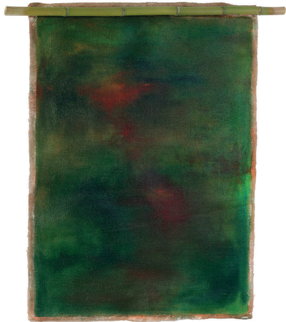
Valentina Agostini Pregelj, Svitek, 2021, olje na platnu, 104 x 78 cm