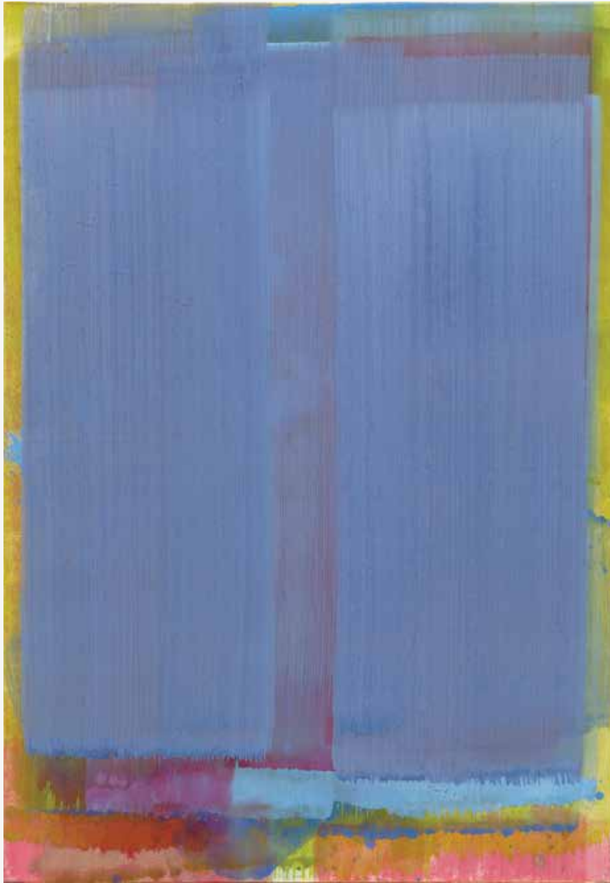
Murvina vrata, 2015, akril, papir, platno, 176 x 122cm