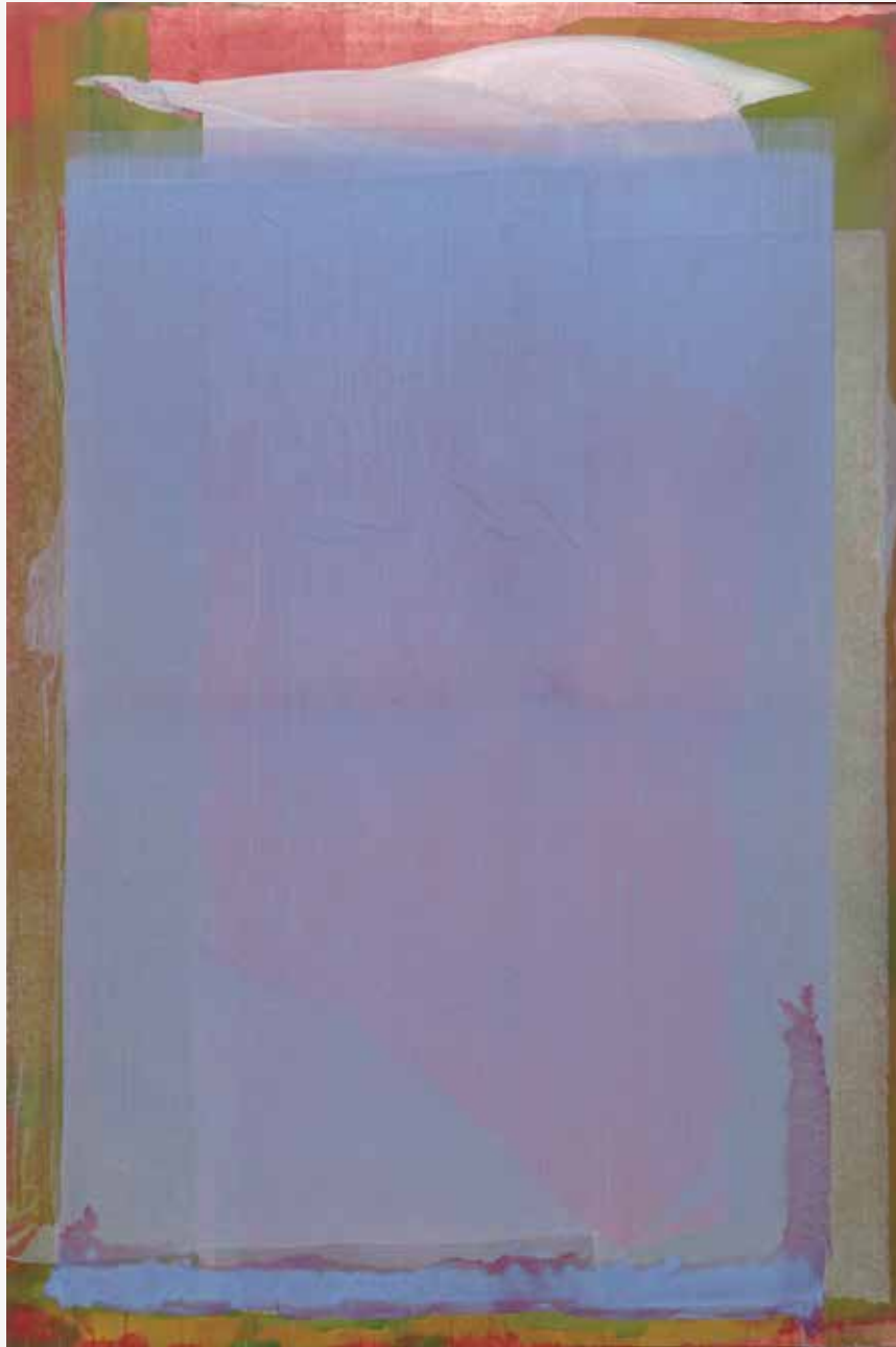
Glavni vhod, 2015, akril, papir, platno, 210 x 140cm