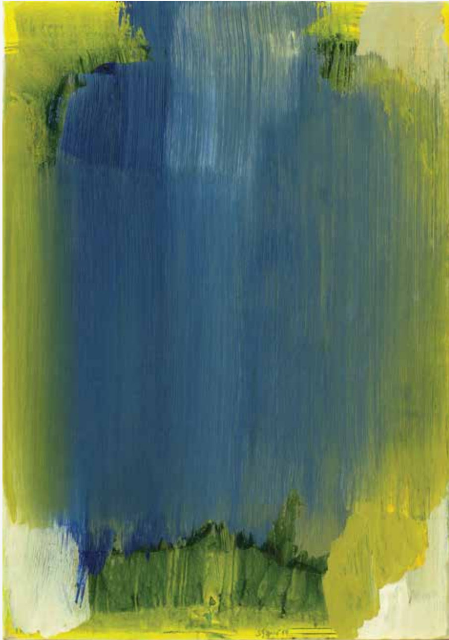
Happening II, 2014, akril, papir, platno, 100 x 70,5cm