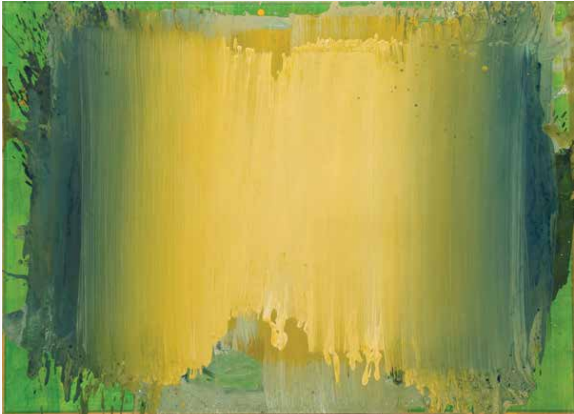
Happening, 2014, akril, papir, platno, 110 x 152cm