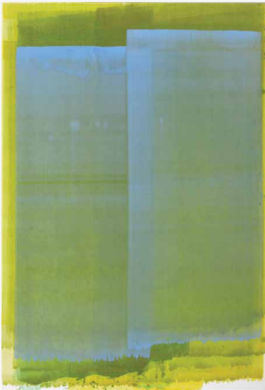
Dvokrilna, 2014, akril, papir, platno, 142 x 98cm