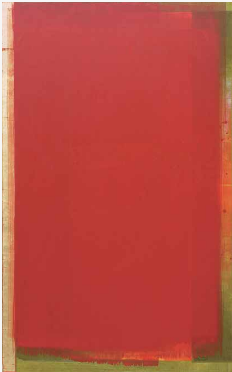
Zlata vrata, 2014, akril, papir, platno, 201,5 x 125cm