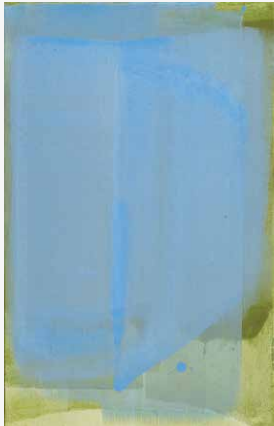
Mali kobalt A in B, 2015, akril, papir, platno, 62 x 39cm