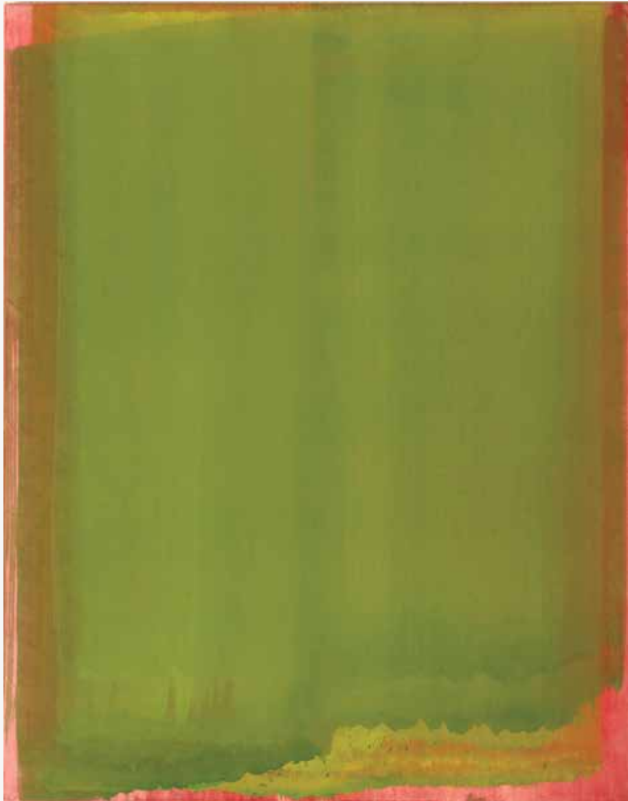
Jutro, 2015, akril, papir, platno, 125 x 98cm