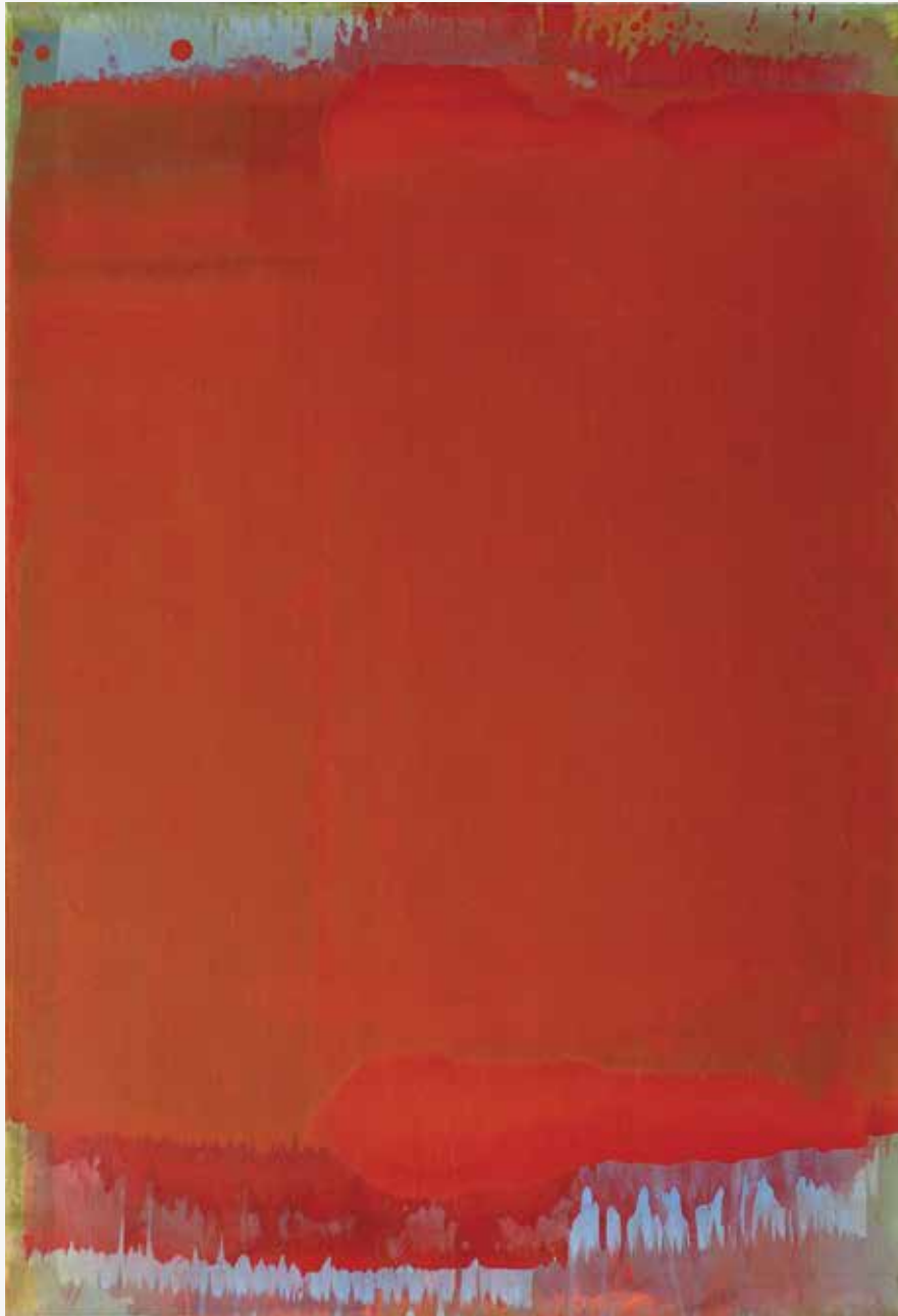
Rdeča b. n., 2014, akril, papir, platno, 118 x 81cm