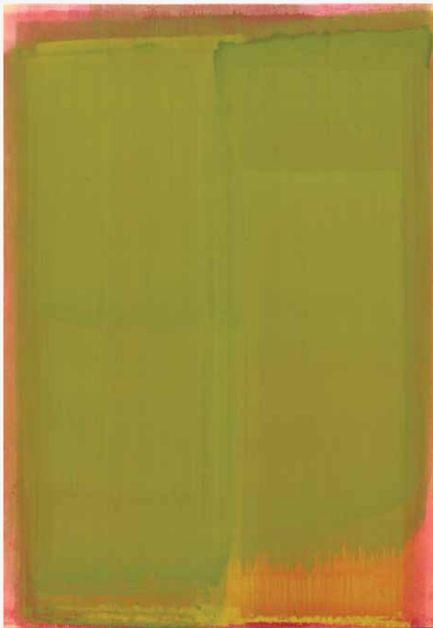
Zelena vrata II, 2015, akril, papir, platno, 180 x 125cm