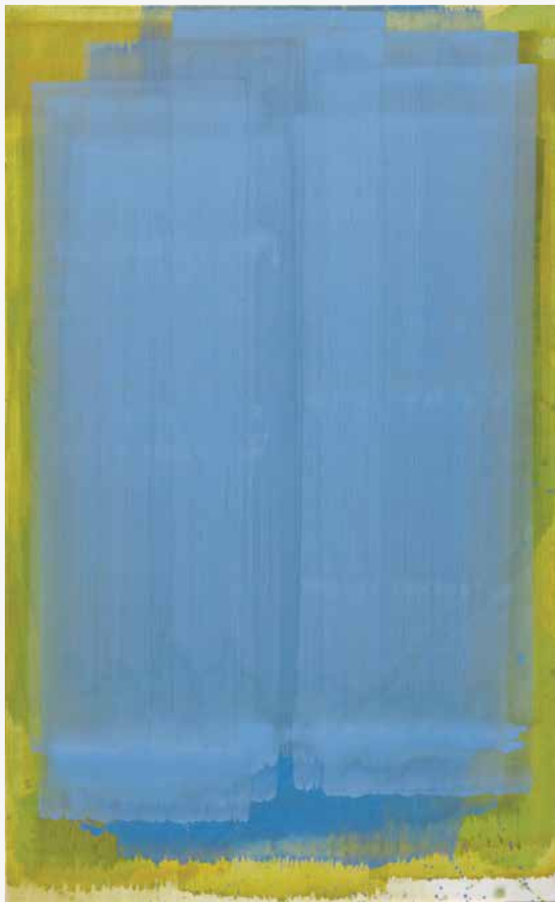
Kobalt, 2015, akril, papir, platno, 210 x 129cm