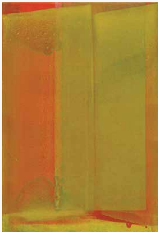
Jutro II, III, 2015, akril, papir, platno, 55 x 37,5cm