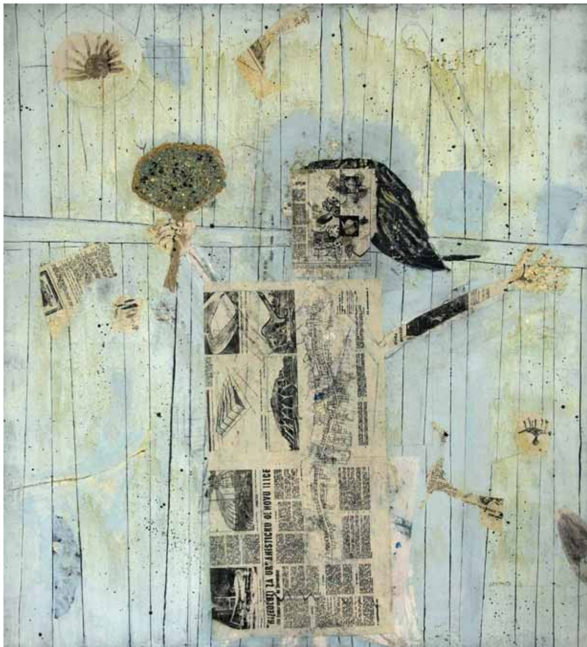
DEKLICA S ŠOPKOM III, 1959 tempera / platno 128 x 117 cm sign. d. sp.: STUPICA G.