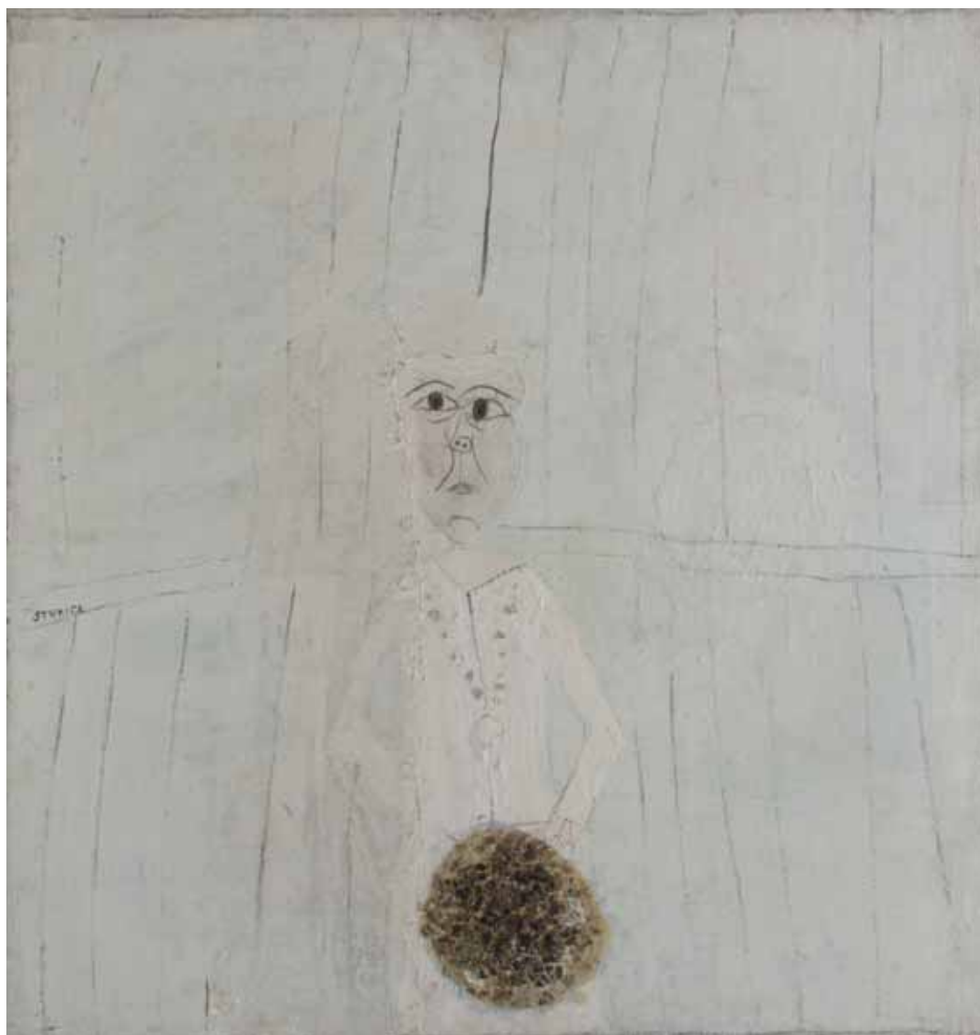
DEKLICA S PAJČOLANOM, 1961 tempera / platno 77 x 74 cm sign. ob l. robu v sr.: STUPICA