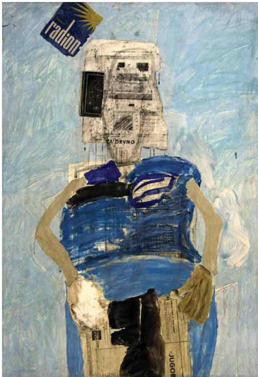
KMETICA, ok. 1970 tempera, kolaž / platno 102,5 x 73 cm ni sign.