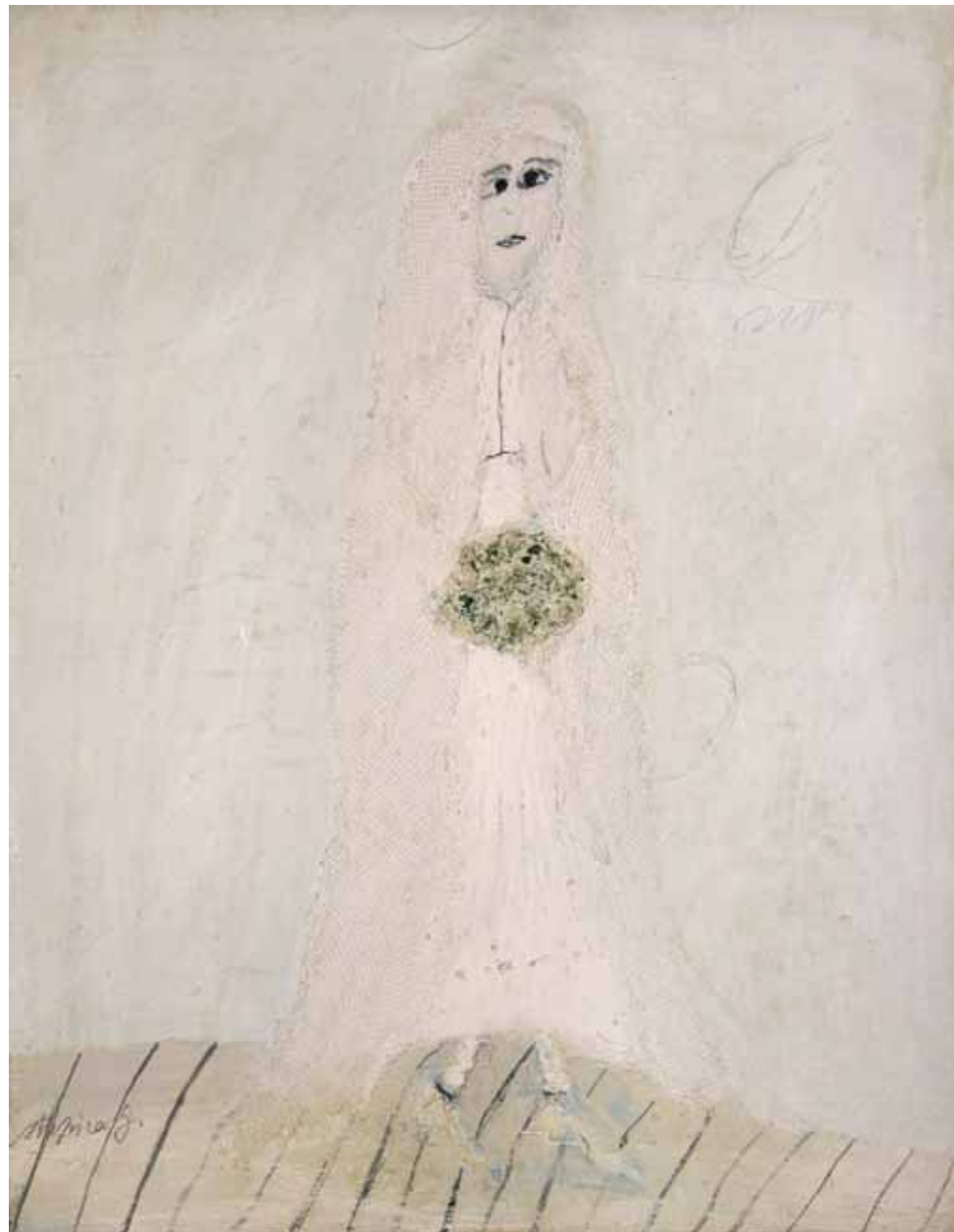
MALA NEVESTA, ok. 1968 -74 tempera / platno 40,5 x 31,5 cm sign. l. sp.: Stupica G.