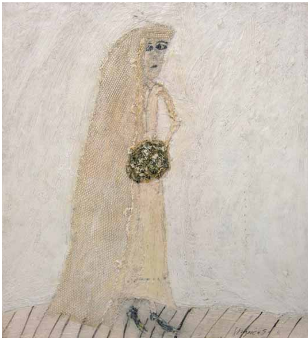
MALA NEVESTA, ok. 1968 -74 tempera / platno 32,5 x 30 cm sign. d. sp.: Stupica G.