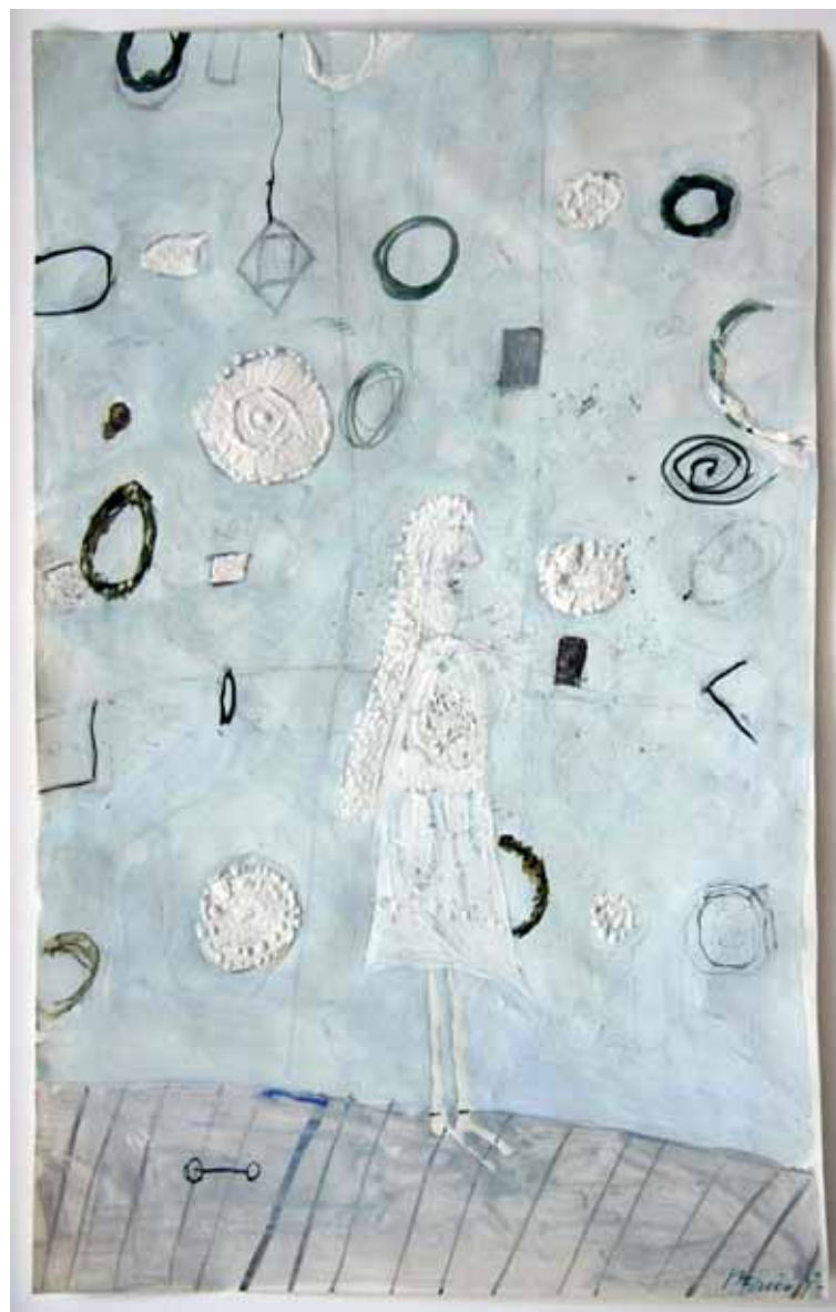
BELA ŽENA, ok. 1975 tempera / papir 30 x 19 cm sign d. sp.: Stupica G.