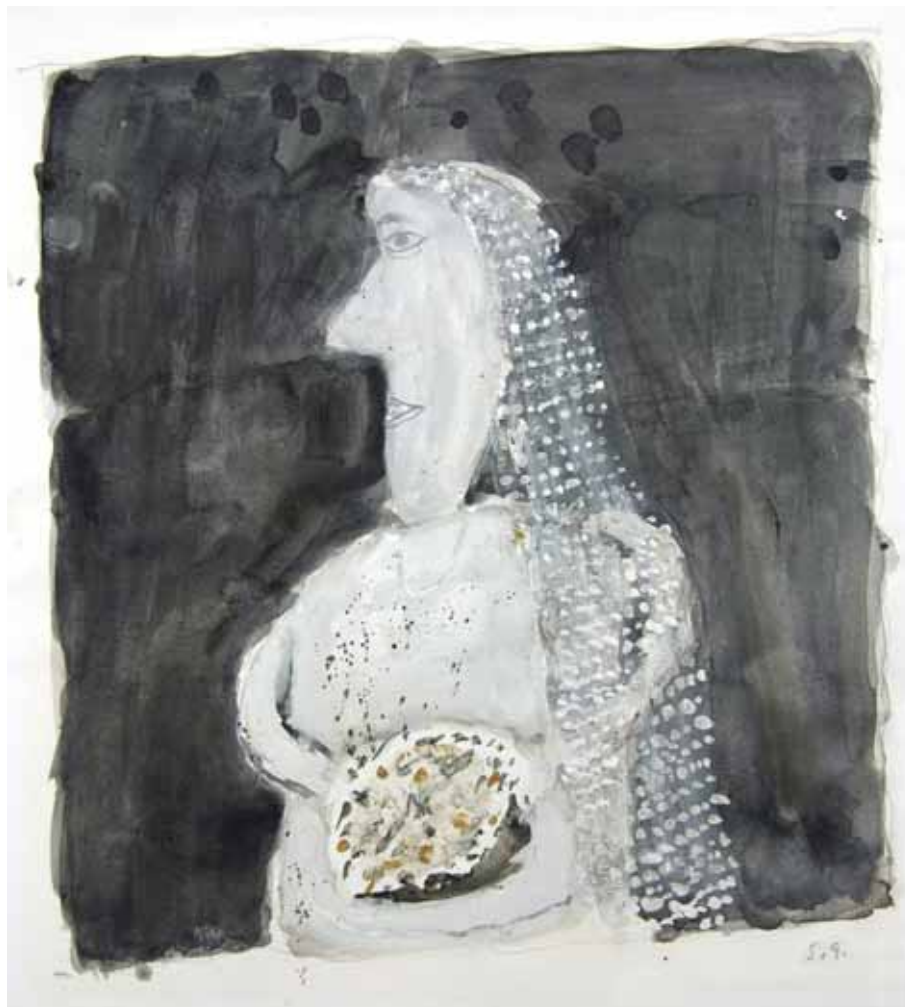
ŽENA V BELEM / ČRNA NEVESTA, ok. 1975 gvaš / papir 26,5 x 23 cm sign. d. sp.: S. G.