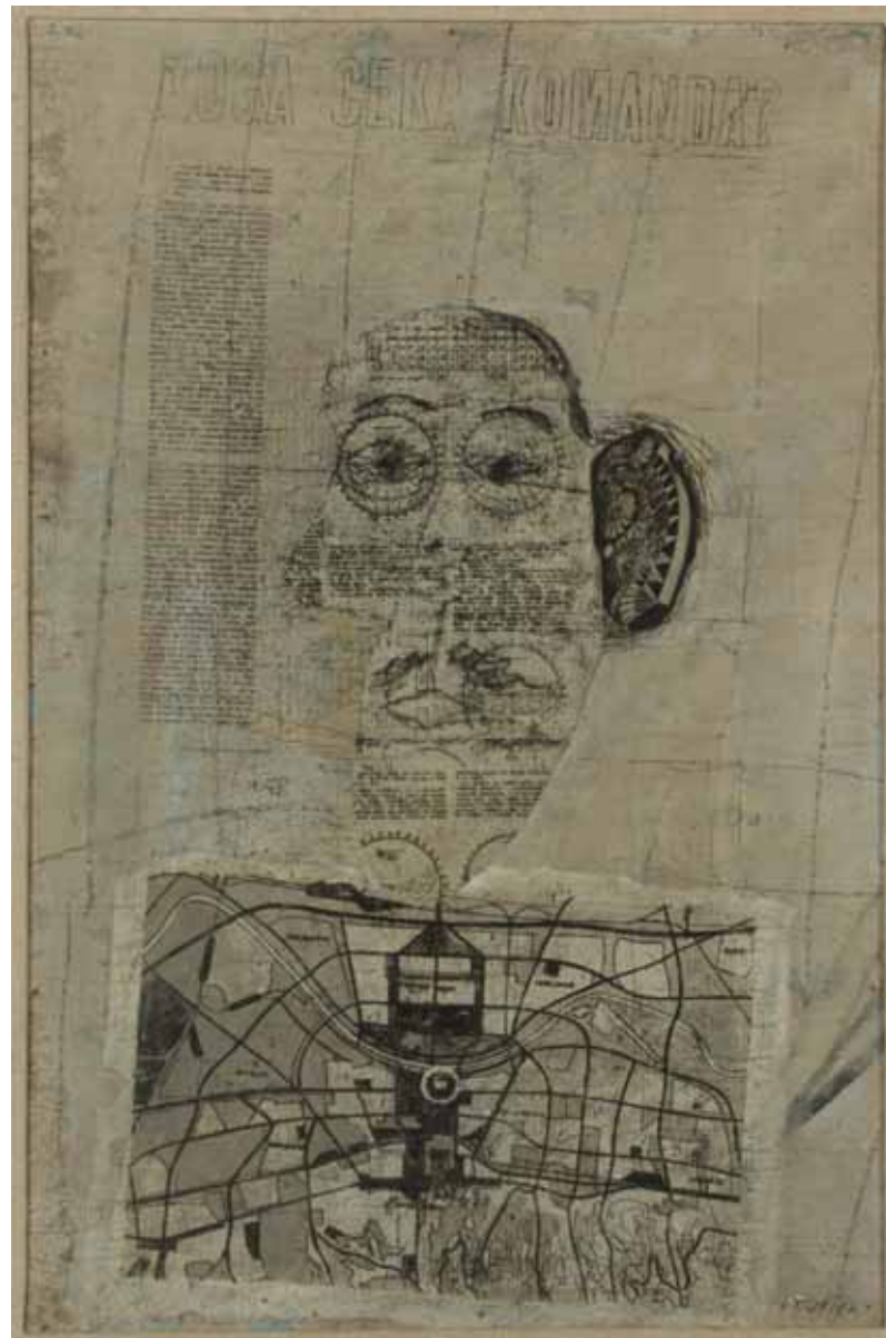
AVTOPORTRET, verj. zgod. 60. leta tempera / platno na vezano ploščo 68 x 45 cm sign d. sp.: Stupica