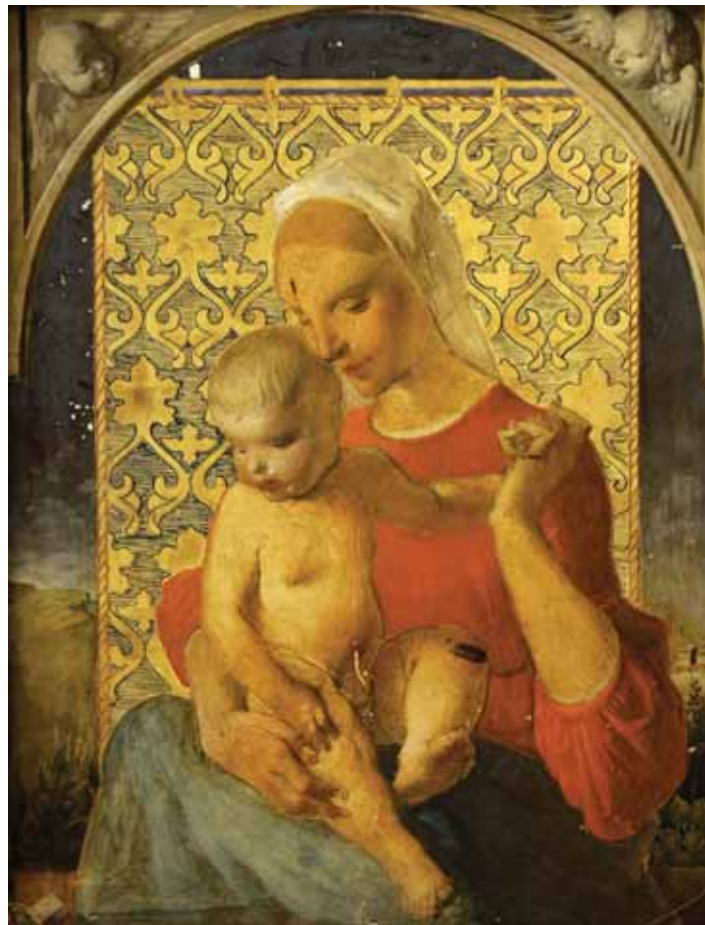
NEVESTA, 1965 olje, tempera / platno 46 x 37 cm sign. hrbt. l. sp.: S. G.

hrbna stran: MATI Z DETETOM, mešane tehnike / vezana plošča 46 x 37 cm sign. l. sp.: S. G.