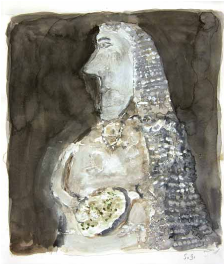
ŽENA V BELEM / ČRNA NEVESTA, ok. 1975 mešane tehnike / papir 25,5, x 22 cm sign. d. sp.: S. G.