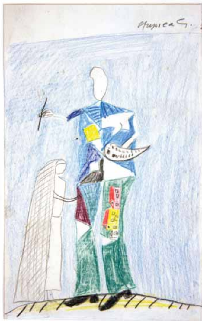
AVTOPORTRET Z NEVESTO, ok. 1959 grafitni, barvni, pastelni svinčniki / papir 16,3 x 10,3 cm sign. d. zg.: Stupica G.