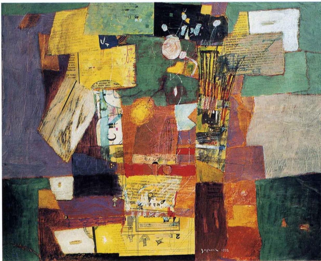
PRIMORSKA VAS , akril na platno, 40x50 cm, 1994