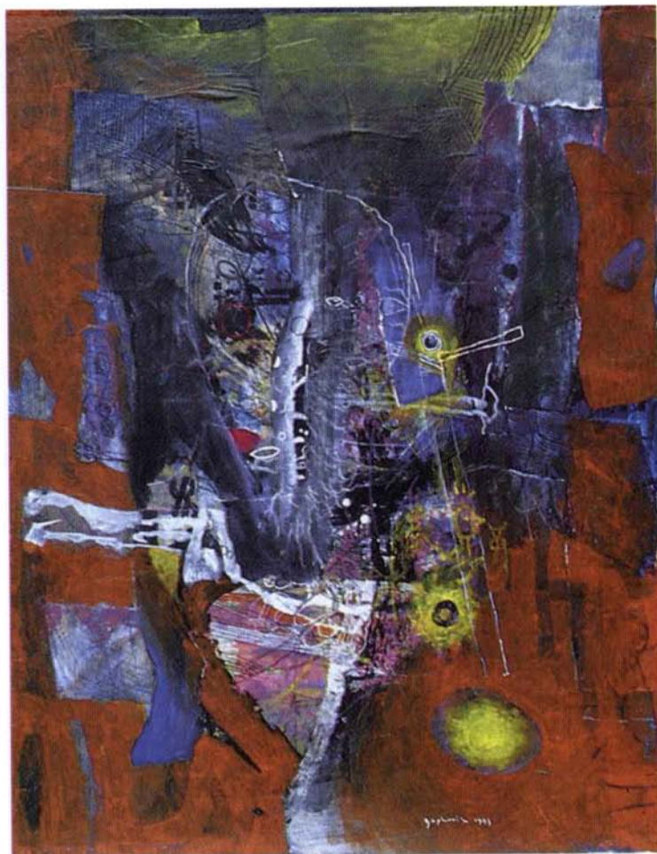
ČRNI OBRAZ , akril na platno, 50x35 cm, 1993