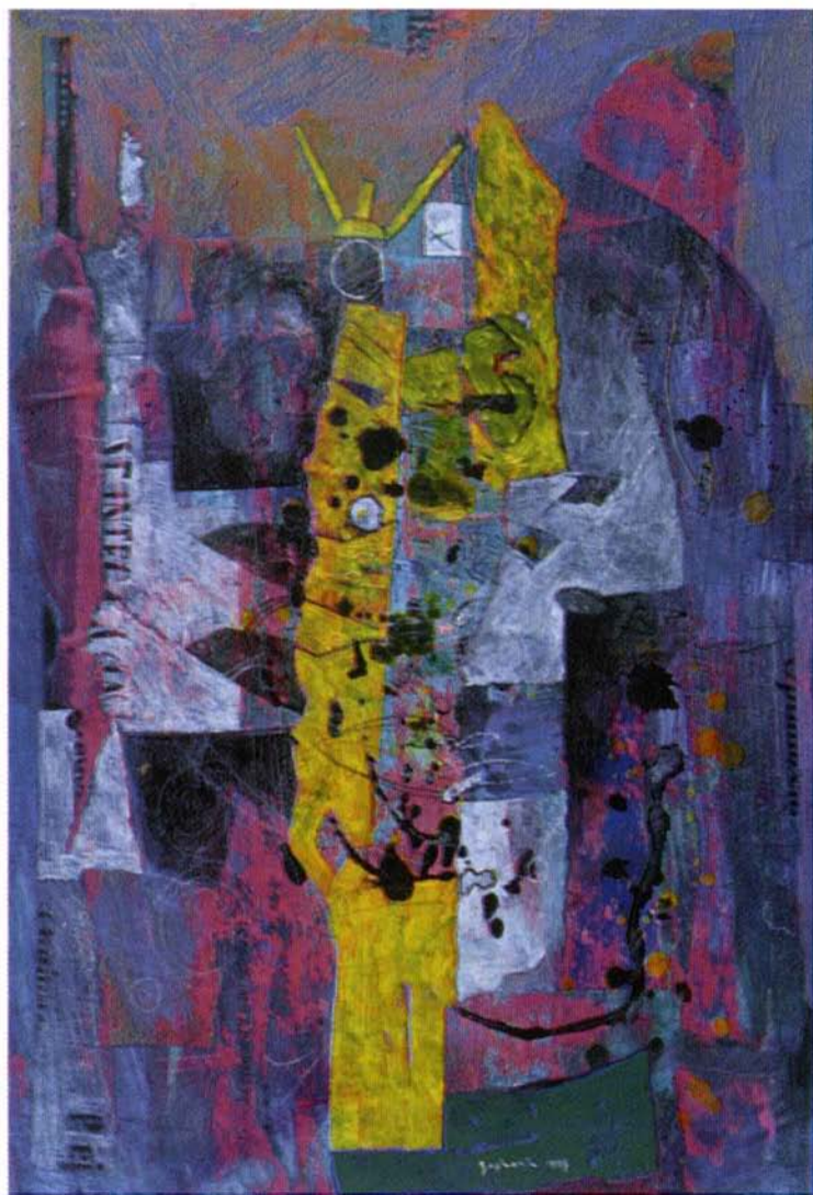
RUMENO OGRINJALO , akril na platno, 50x35 cm, 1993