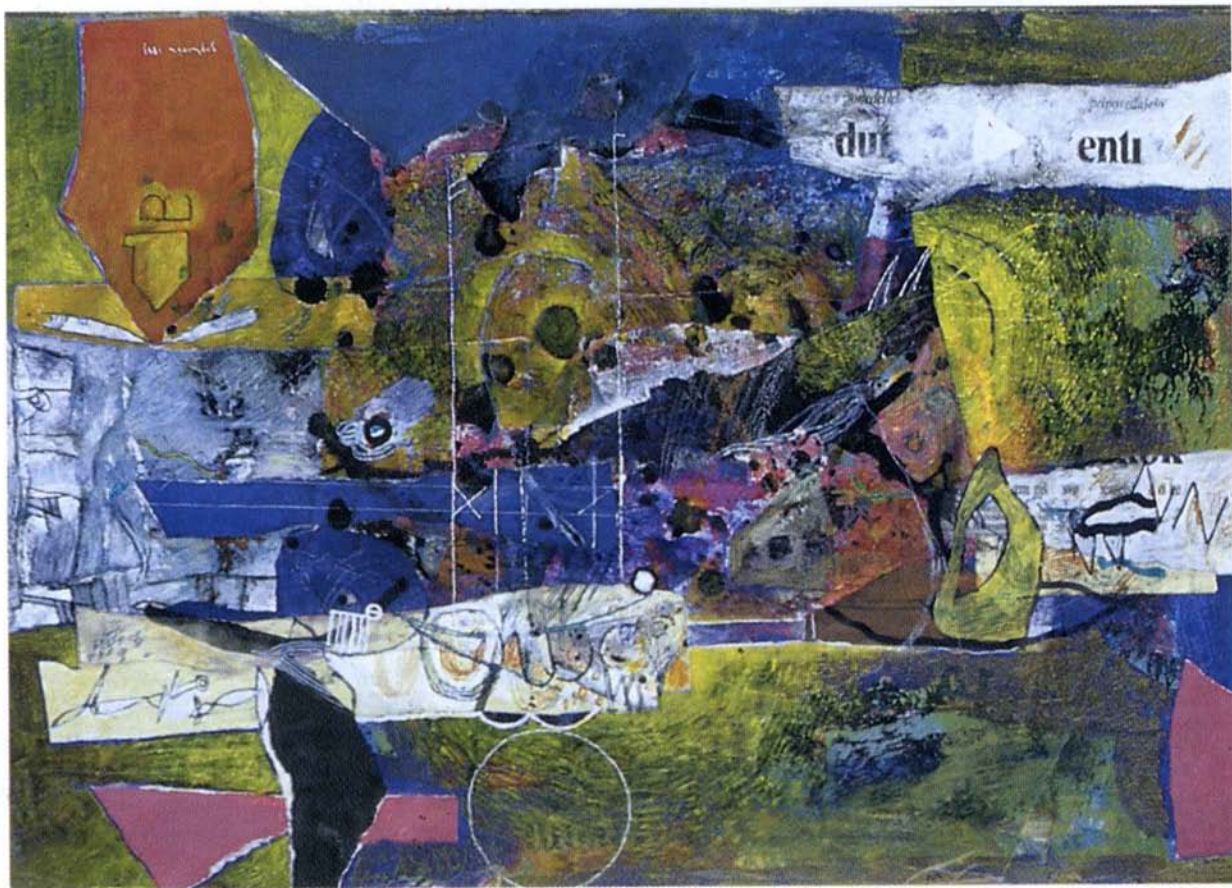
SPREHAJALEC , akril na platno, 35x50 cm, 1993