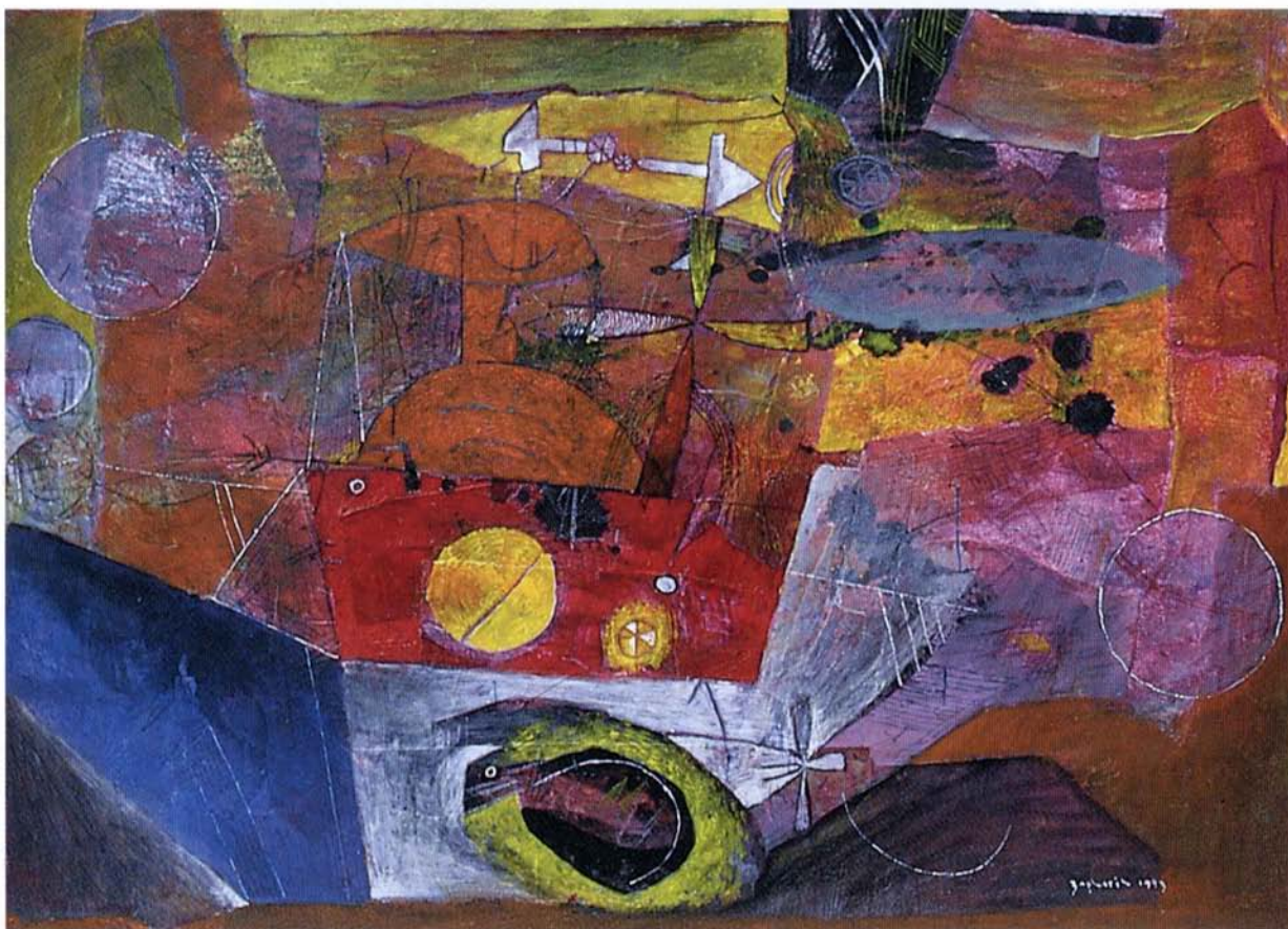
MALI ČOLNIČ , akril na platno, 35x50 cm, 1993