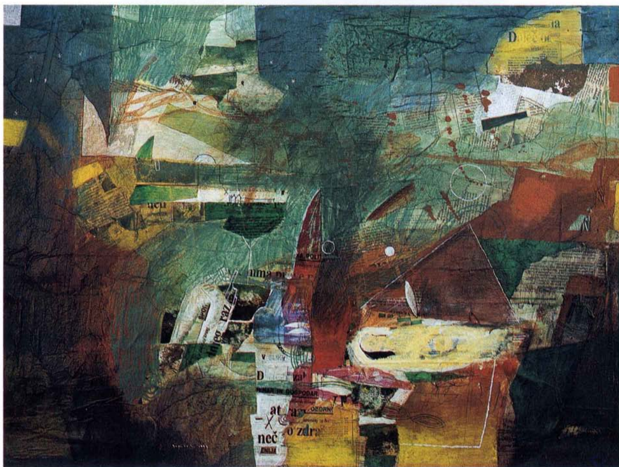
MEGLENO MESTO , akril na platno, 60x80 cm, 1993