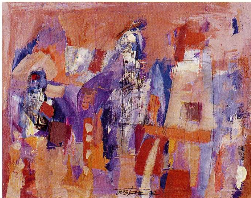
BREZ NASLOVA. olje na platno, 68.5x87 cm