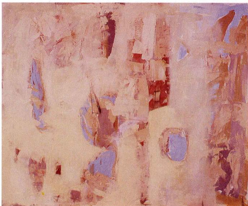
BREZ NASLOVA. olje na platno, 115x140 cm