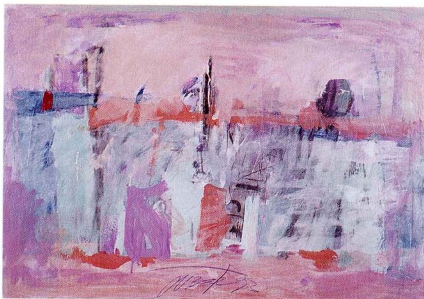
BREZ NASLOVA. olje na karton, 70x101 cm