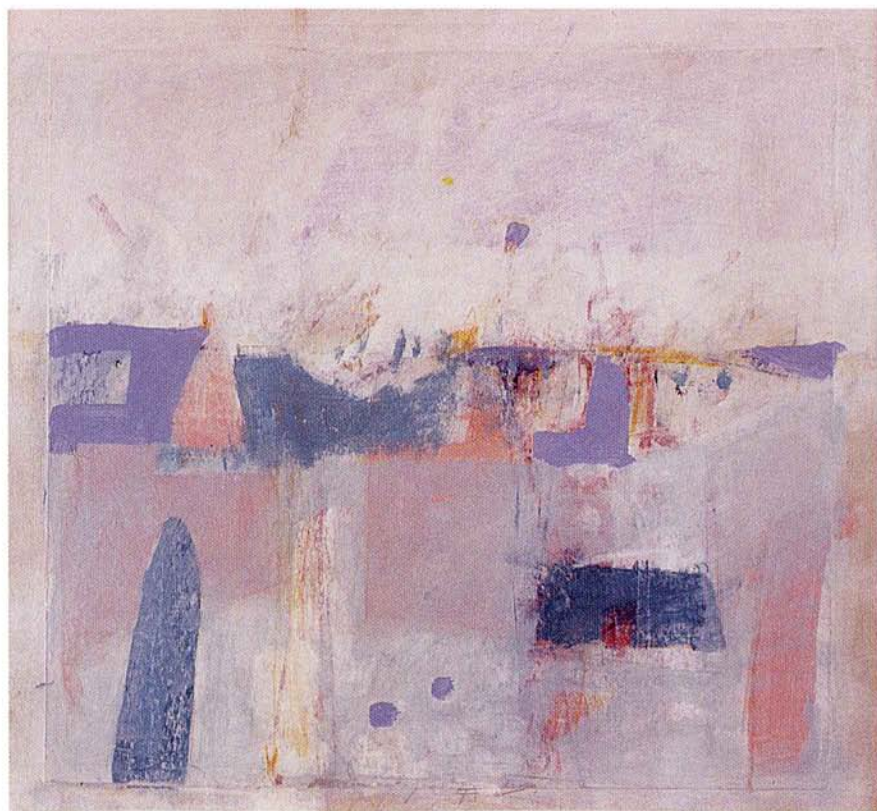
BREZ NASLOVA. olje na platno, 55x60 cm