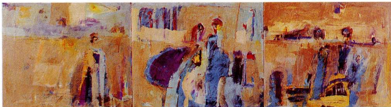
BREZ NASLOVA. olje na les triptih, 58x207 cm