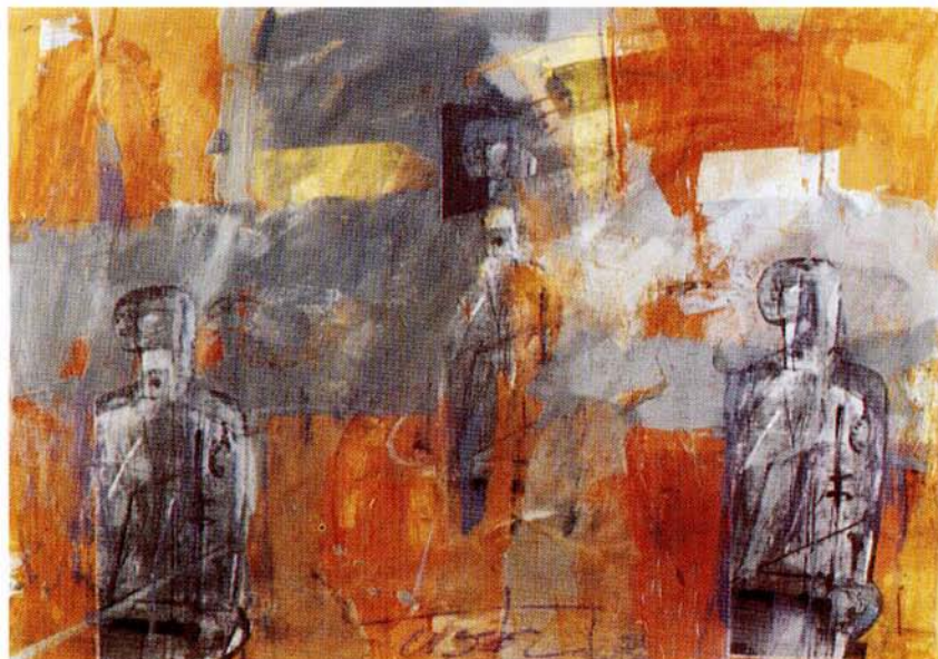
BREZ NASLOVA. olje na karton, 50x60 cm