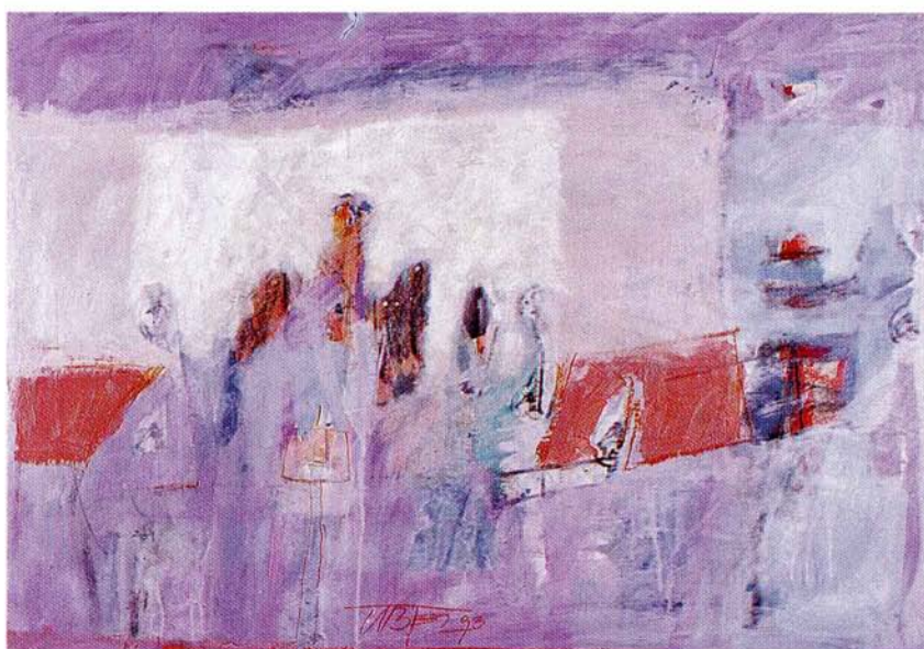
BREZ NASLOVA. olje na karton ,70x101 cm