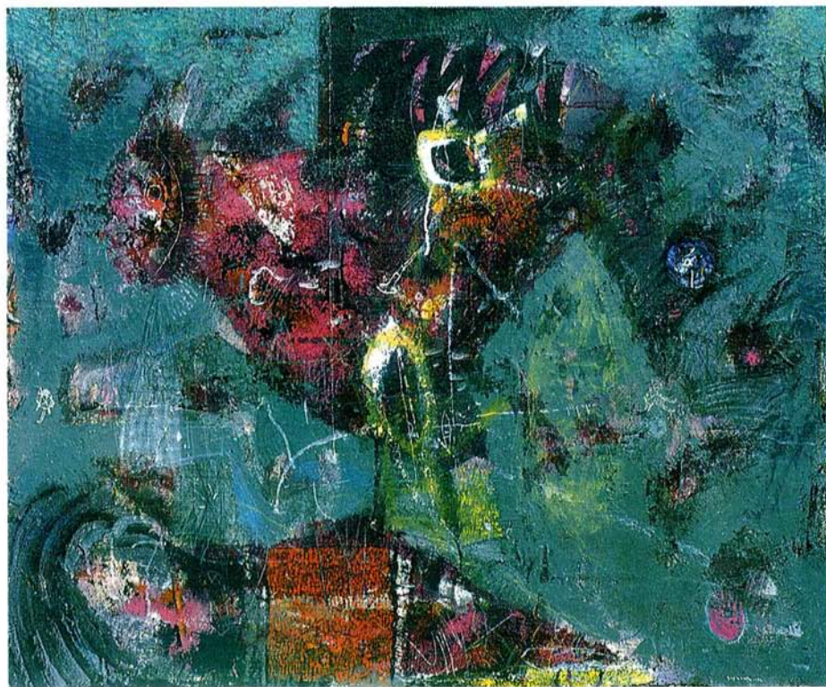
Vojni petelin akril na platno, 100x120 cm, 1992