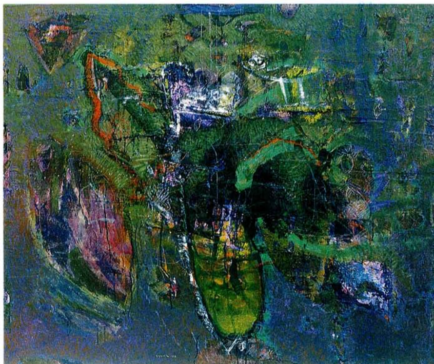
Cvetovi žalujoče narave akril na platno, 100x120 cm, 1992