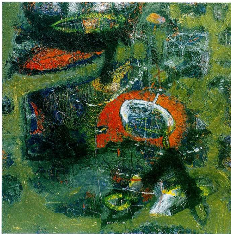
Žareče oči akril na platno, 50x50 cm, 1992