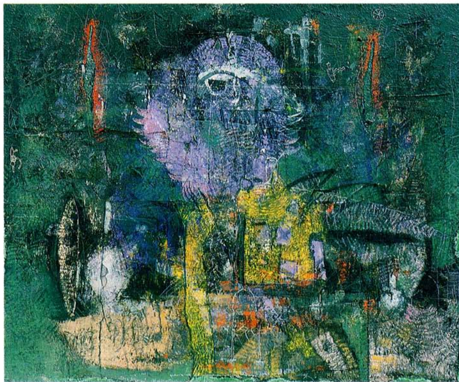
Kiklopov razred akril na platno, 100x120 cm, 1992