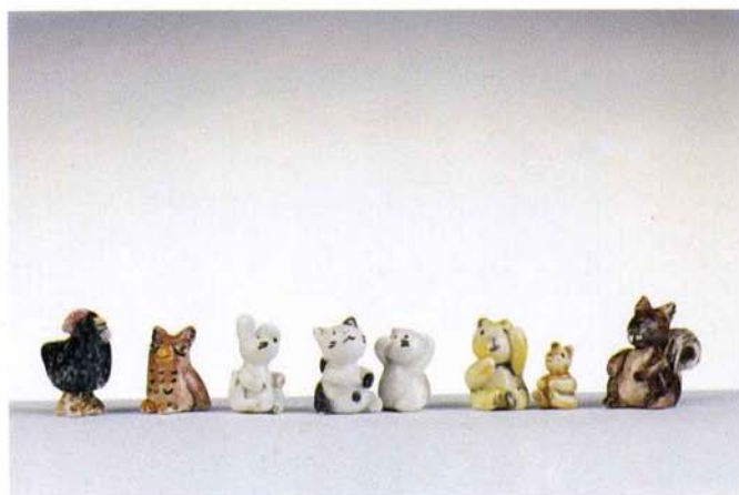
MINIATURA, 2,5 cm