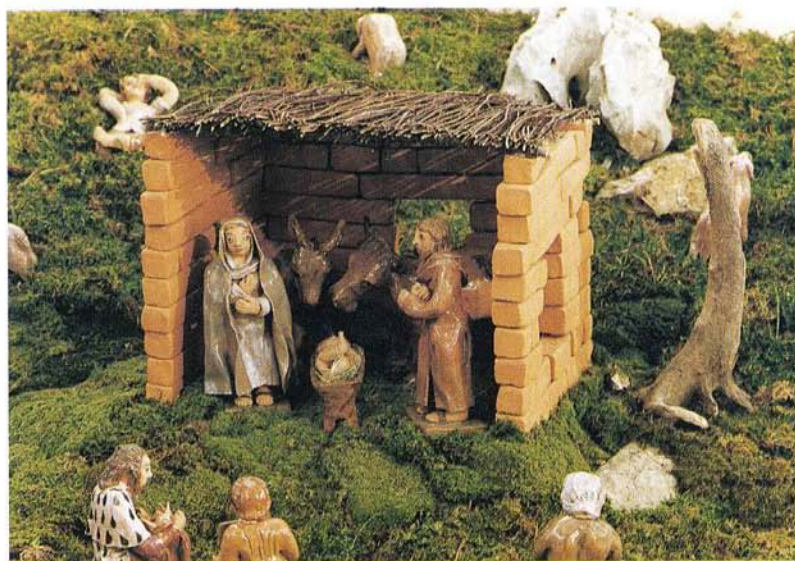
JASLICE, figure, višina 40 cm