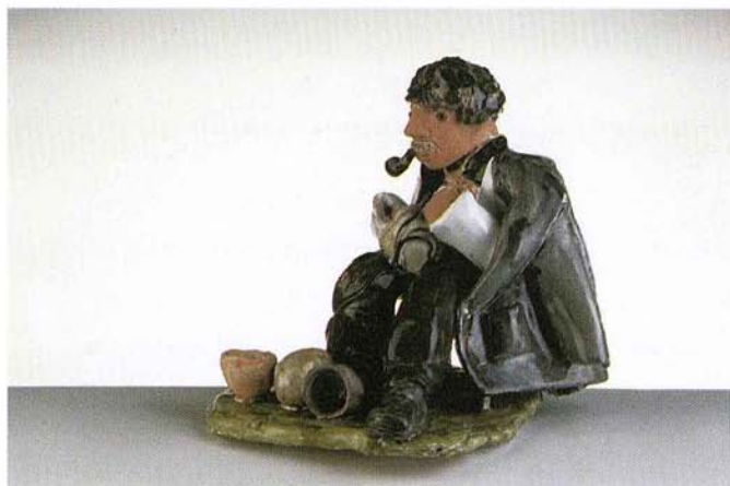
PISKROVEC, 20 x 18 cm