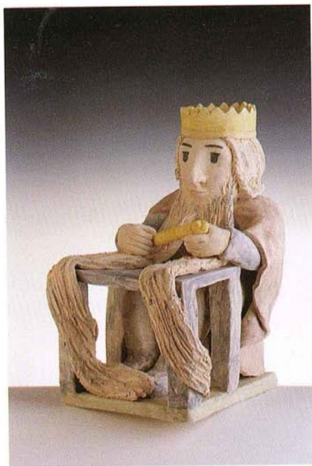
KRALJ MATJAŽ, 43 x 30 cm