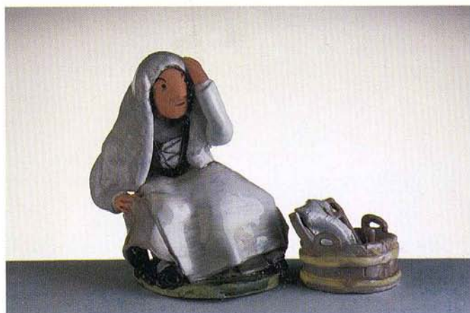
VALVAZORSKA NOŠA, 14 x 16 cm