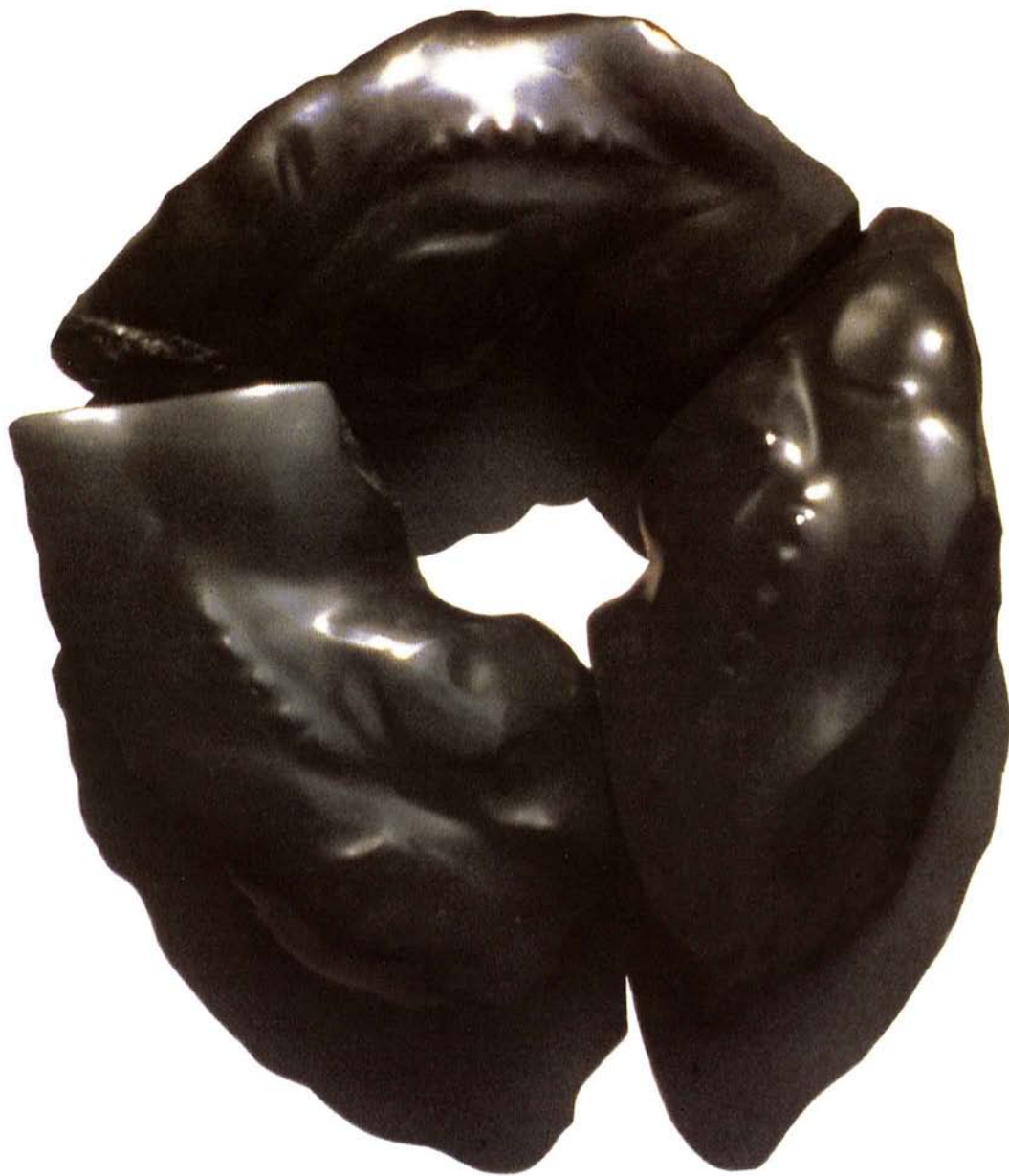
[FIGURE V PROSTORU]