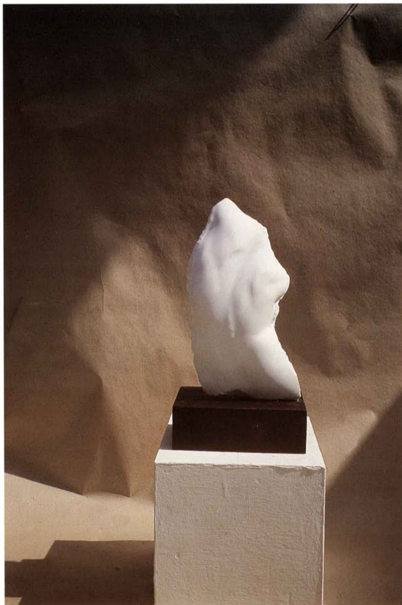
[FIGURA V PROSTORU]