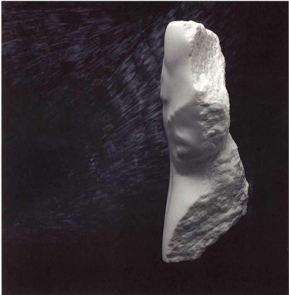
[ FIGURA V PROSTORU ]