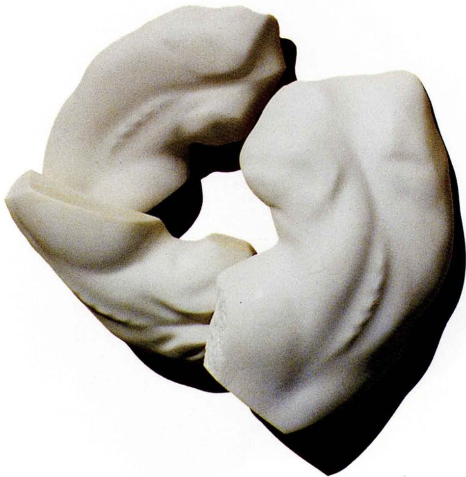
[FIGURE V PROSTORU]