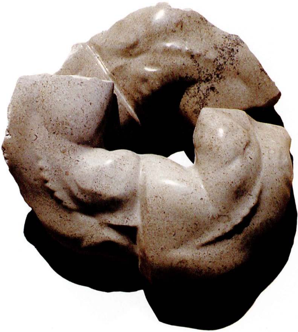
[FIGURE V PROSTORU]