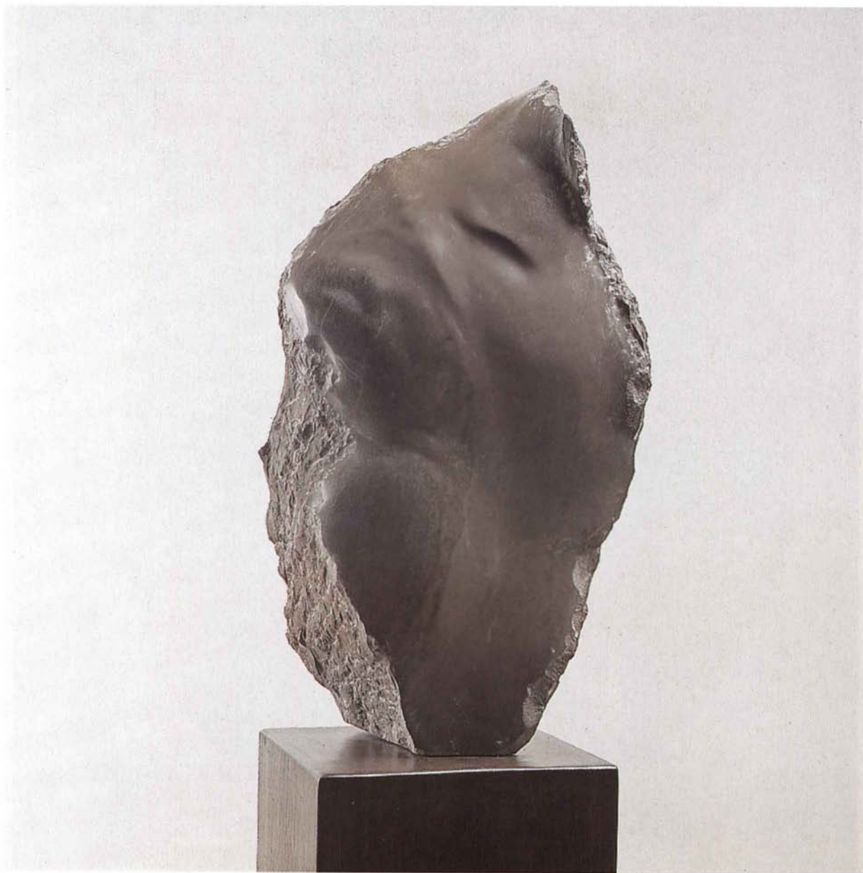
[FIGURA V PROSTORU]