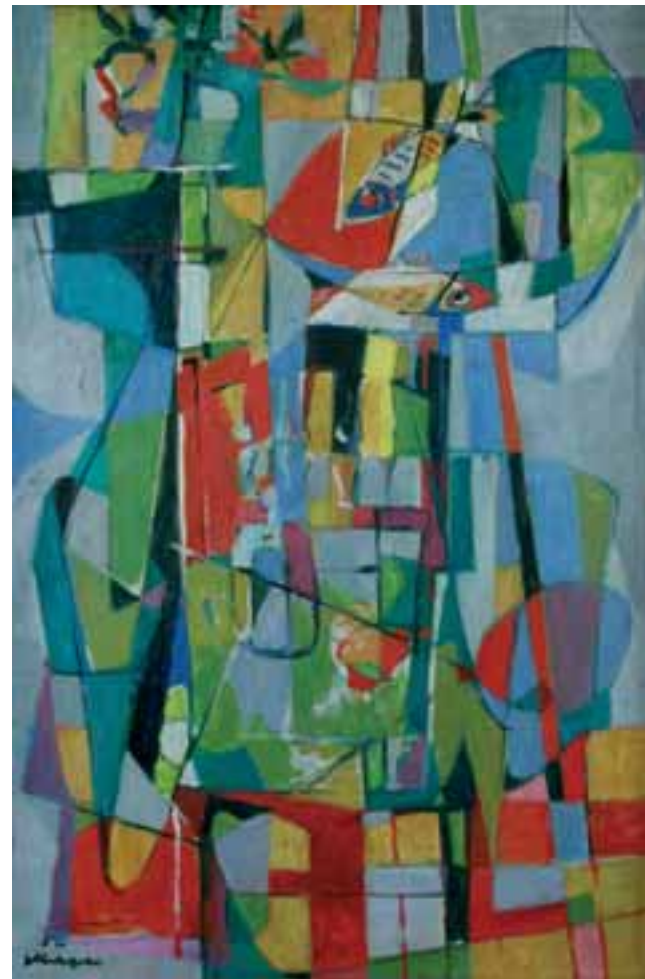
DAFNIS IN CLOE, 1952, olje / platno, 91 x 59 cm, sign. in dat. l. sp.: 52/SKregar