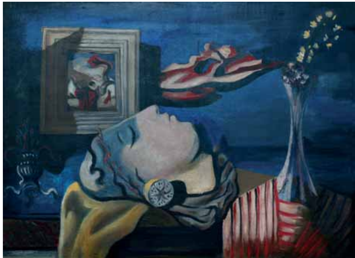
VEČER V MAJU, 1937, olje / platno, 61 x 82 cm, sign. l. zg.: SKregar