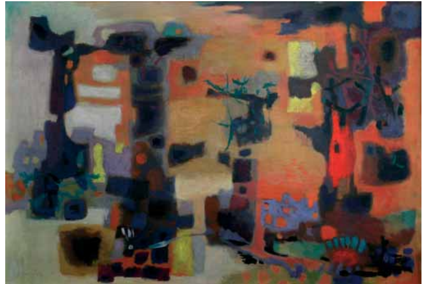
PORUŠENO MESTO, 1958, olje / platno, 89.5 x 131 cm, sign. in dat. l. sp.: 58/SKregar