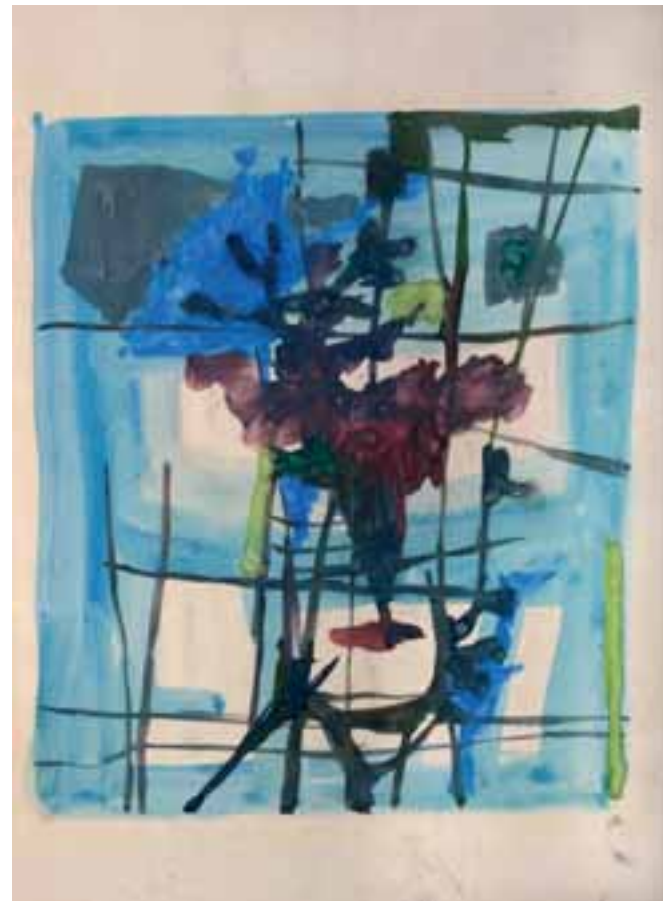
BREZ NASLOVA, 1954, akvarel / papir, 30 x 25 cm, sign. ni.