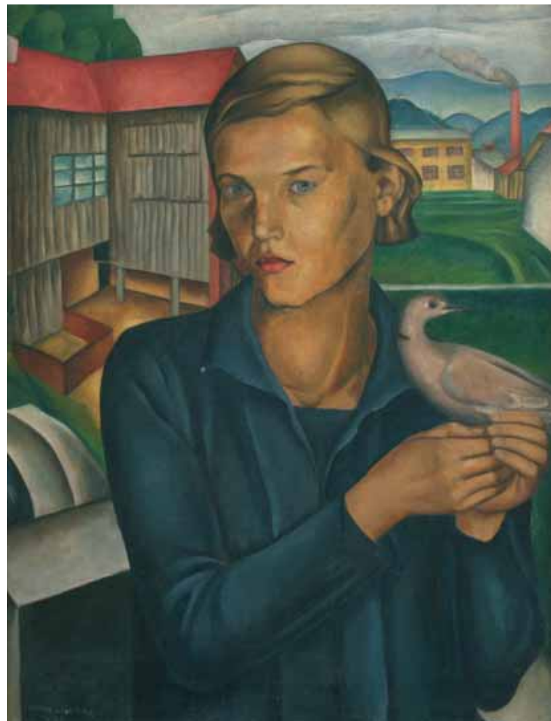
DEKLE Z GRILICO, 1930, olje / platno, 68 x 53 cm, sign. in dat. l. sp.: STANE KREGAR/1930