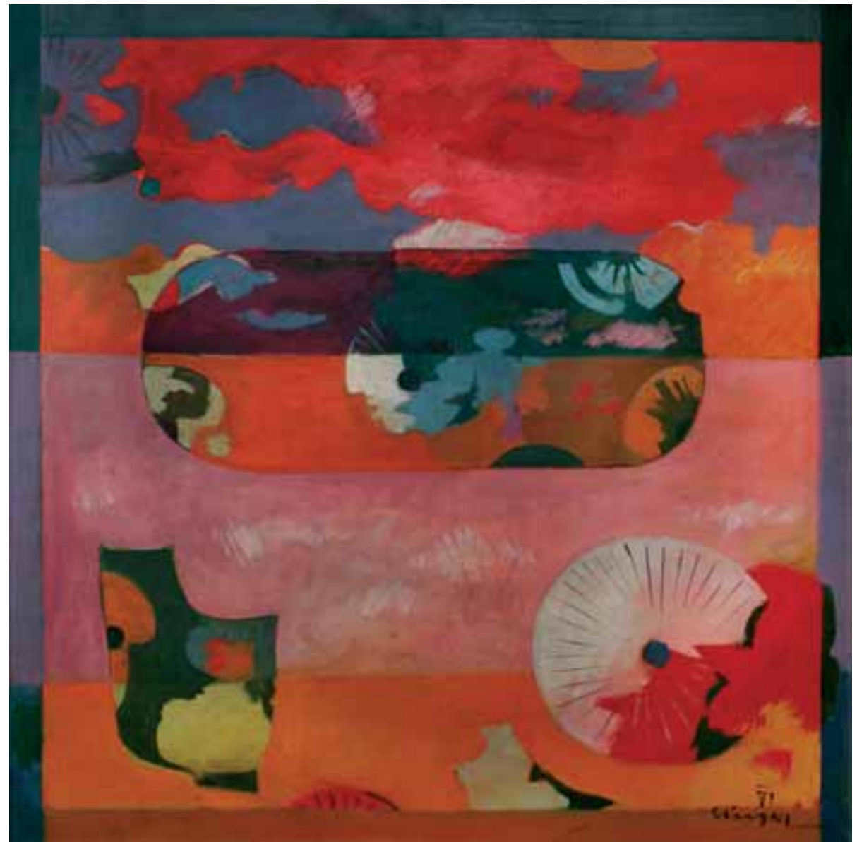
BREZ NASLOVA, 1971, olje / platno, 100 x 100 cm, sign. in dat. d. sp.: 71/SKregar