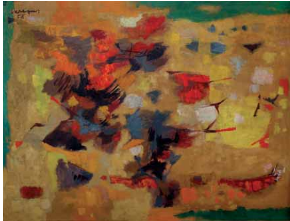
RAZPADANJE, 1958, olje / platno, 89 x 116 cm, sign. in dat. l. zg.: SKregar/58