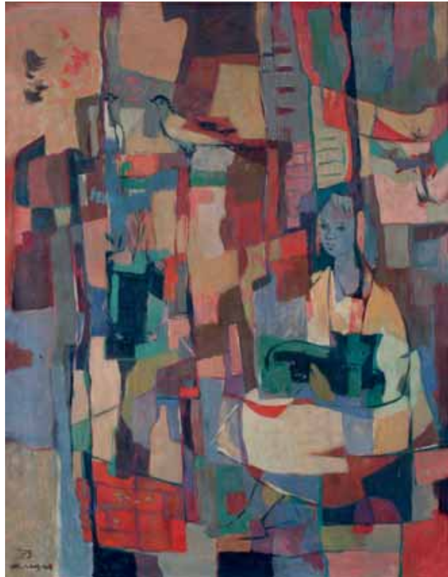
DEKLICA Z MUCKO, 1953, olje / platno, 116 x 89 cm, sign. in dat. l. sp.: 53/SKregar