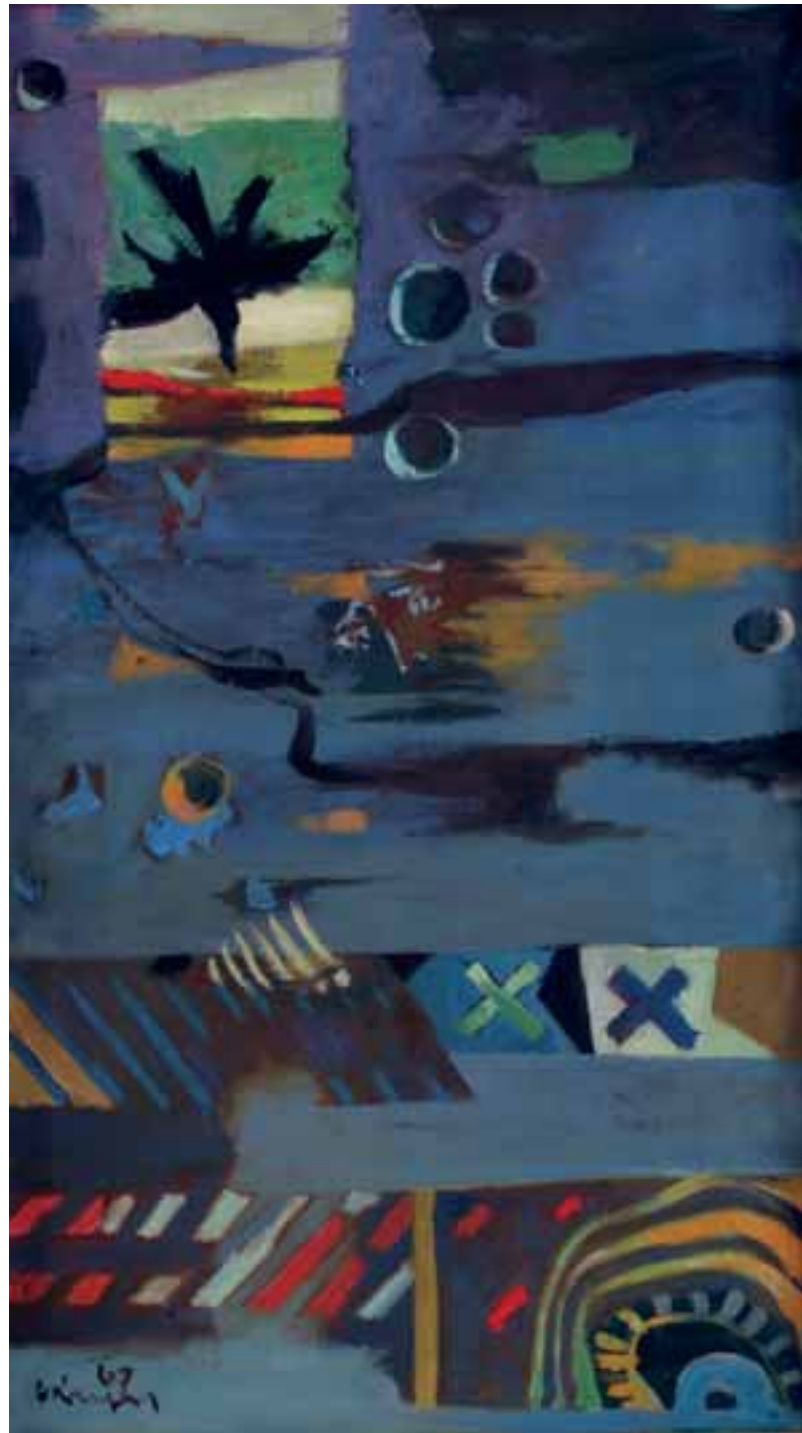
MRAČNA ZNAMENJA, 1967, olje / platno, 115 x 65 cm, sign. in dat. l. sp.: 67/SKregar