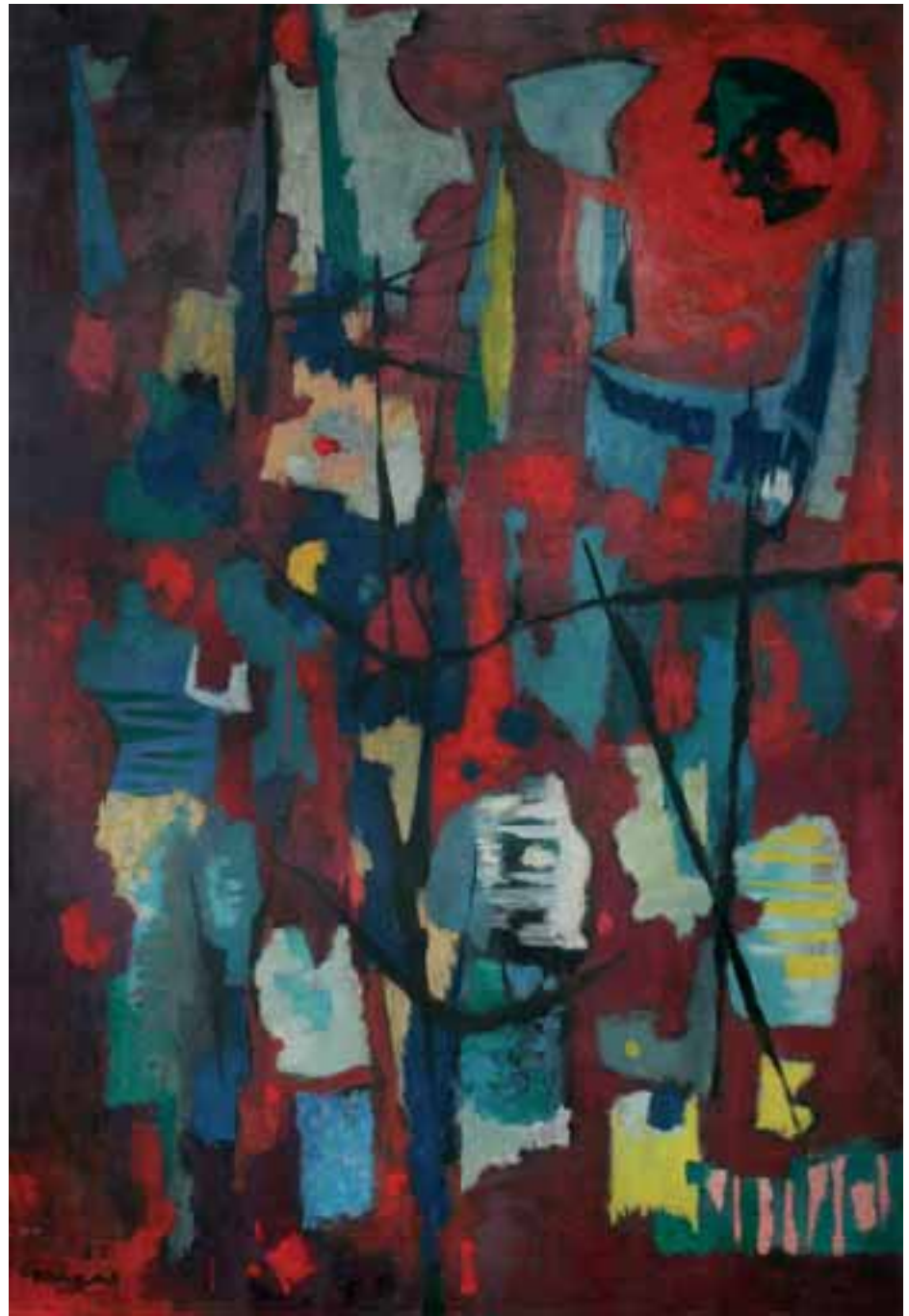
ČRNO SONCE, 1955, olje / platno, 130 x 89 cm, sign. in dat. l. sp.: 55/SKregar