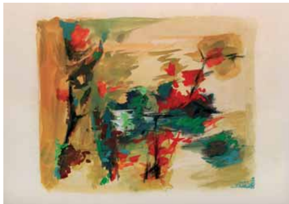
MAJSKA NOČ, 1959, gvaš, kreda / papir, 24 x 29 cm, sign. ni., dat. zadaj.