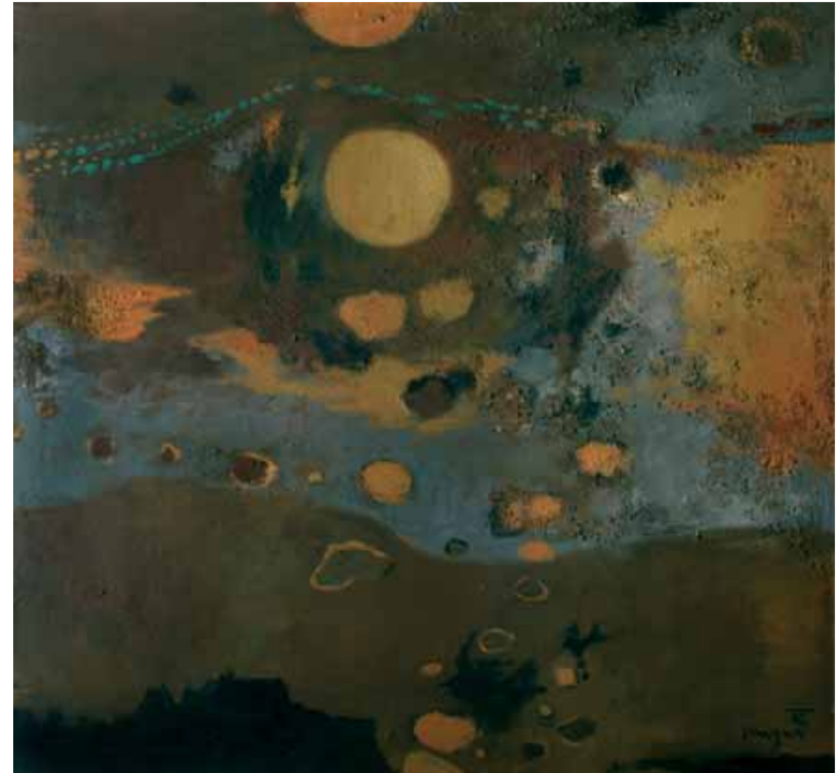
OBALA V MESEČINI, 1962, olje / platno, 110 x 120 cm, sign. in dat. d. sp.: 62/SKregar