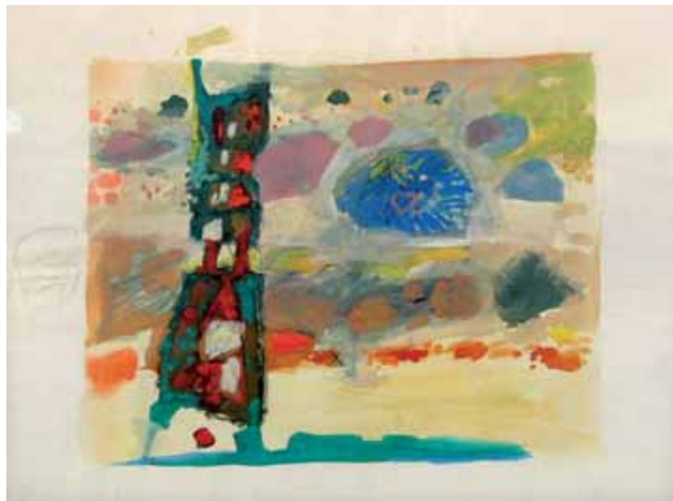
BREZ NASLOVA, 1956, gvaš, kreda / papir, 22 x 28 cm, sign. ni.