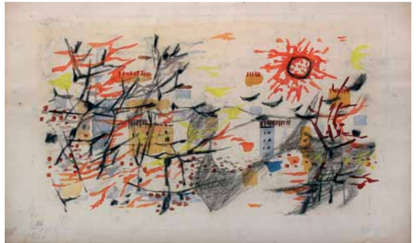
BREZ NASLOVA, 1958, gvaš / papir, 25 x 41 cm, sign. ni.