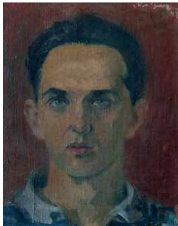
AVTOPORTRET, 1933, olje / platno, 36 x 30 cm, sign. d. zg.: SKregar/33