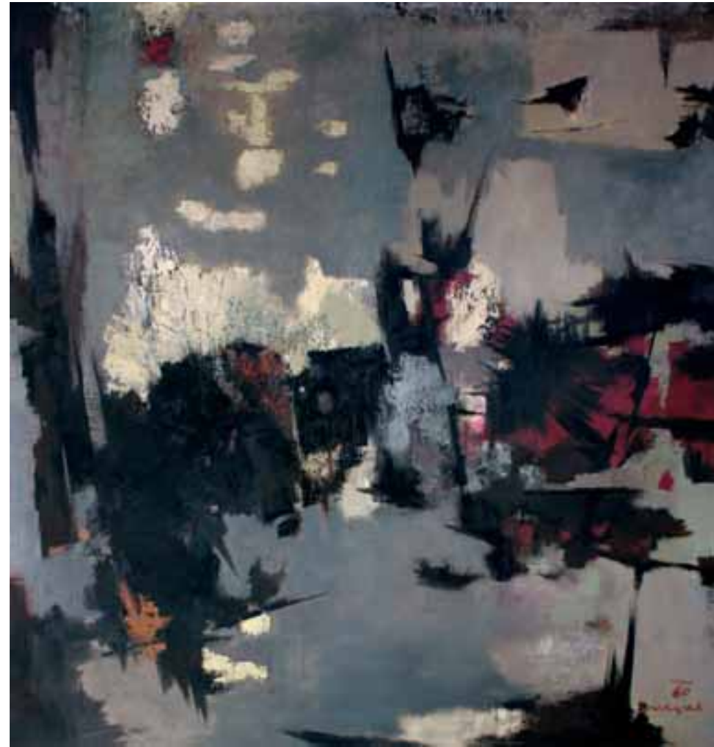
NOVEMBER, 1960, olje / platno, 130 x 116 cm, sign. in dat. d. sp.: 60/SKregar