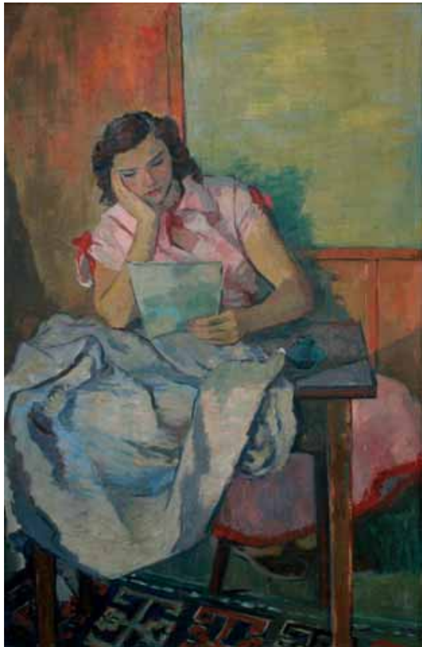
DEKLE S PISMOM, 1950, olje / platno, 110 x 70 cm, sign. ni.