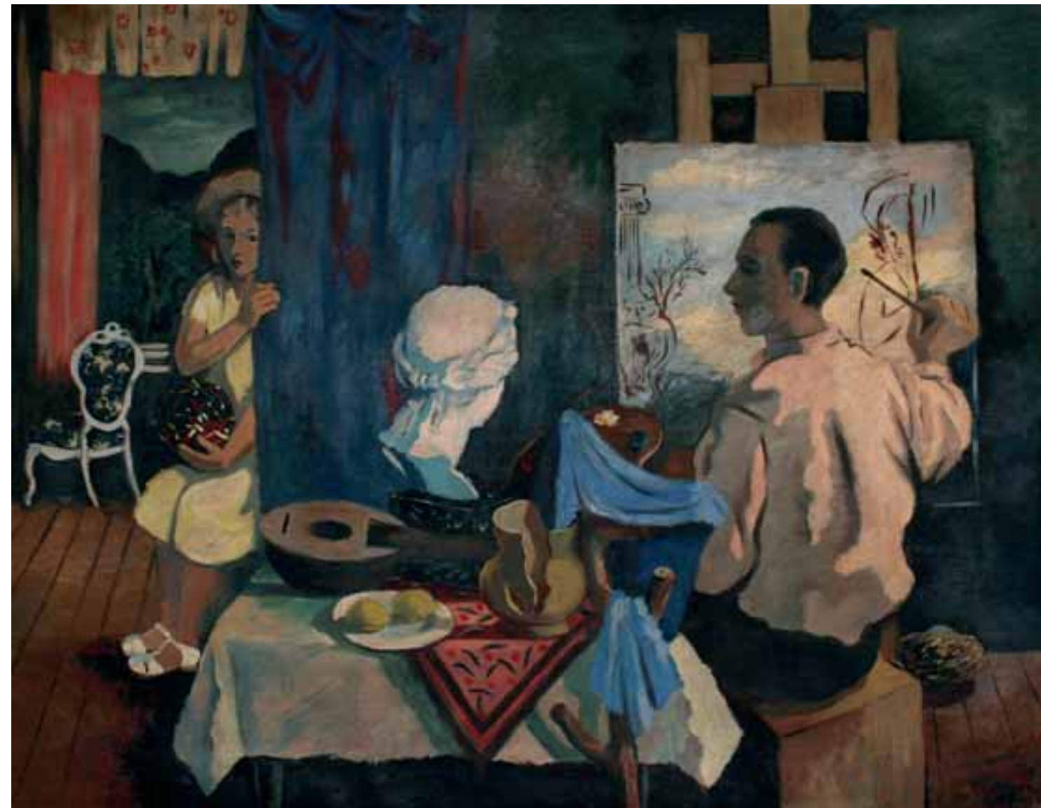
SLIKAR V ATELJEJU, 1939, olje / platno, 100 x 126 cm, sign. in dat. d. sp.: SKregar/39