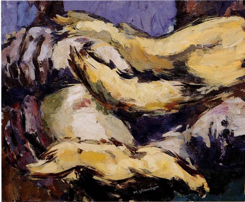
Svetlolaska 1996, 110x90, olje, platno