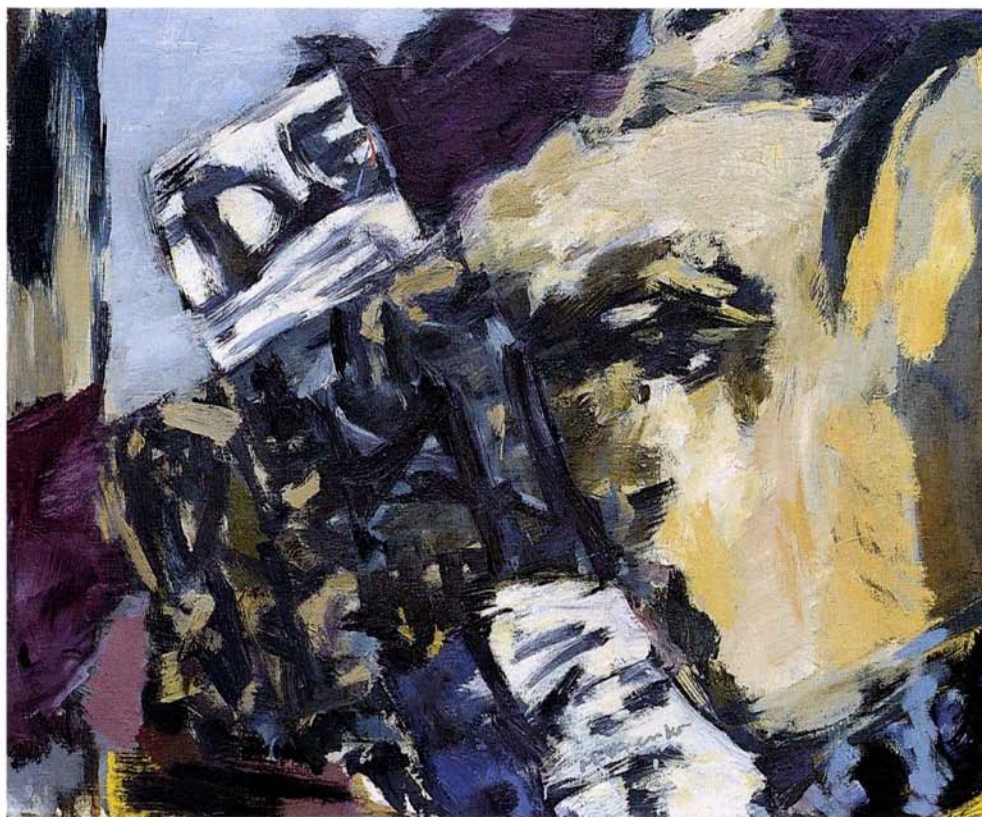
Ovčar 1996, 110x90, olje, platno