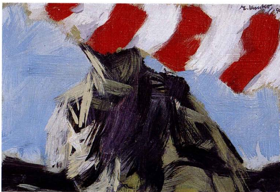
Casablanca 1996, 44x29,5, olje, platno