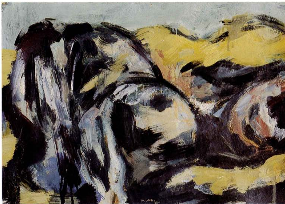
Študija blondinke II 1996, 71x51, olje, platno