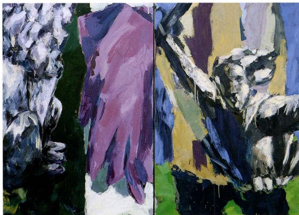
Vrtnar 1996, 140, 5x100, olje, platno