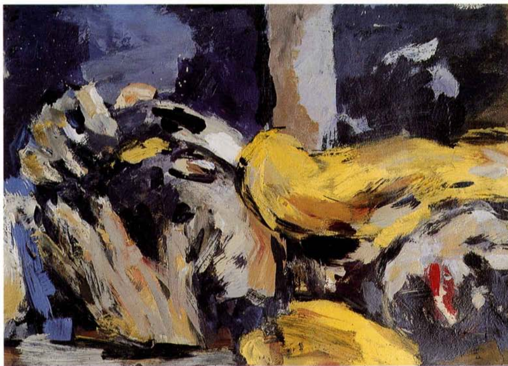
Študija blondinke I 1996, 71x51, olje, platno