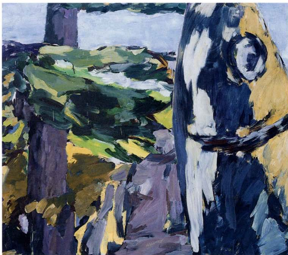
Fažana 1994, 171, 5x152, olje, platno